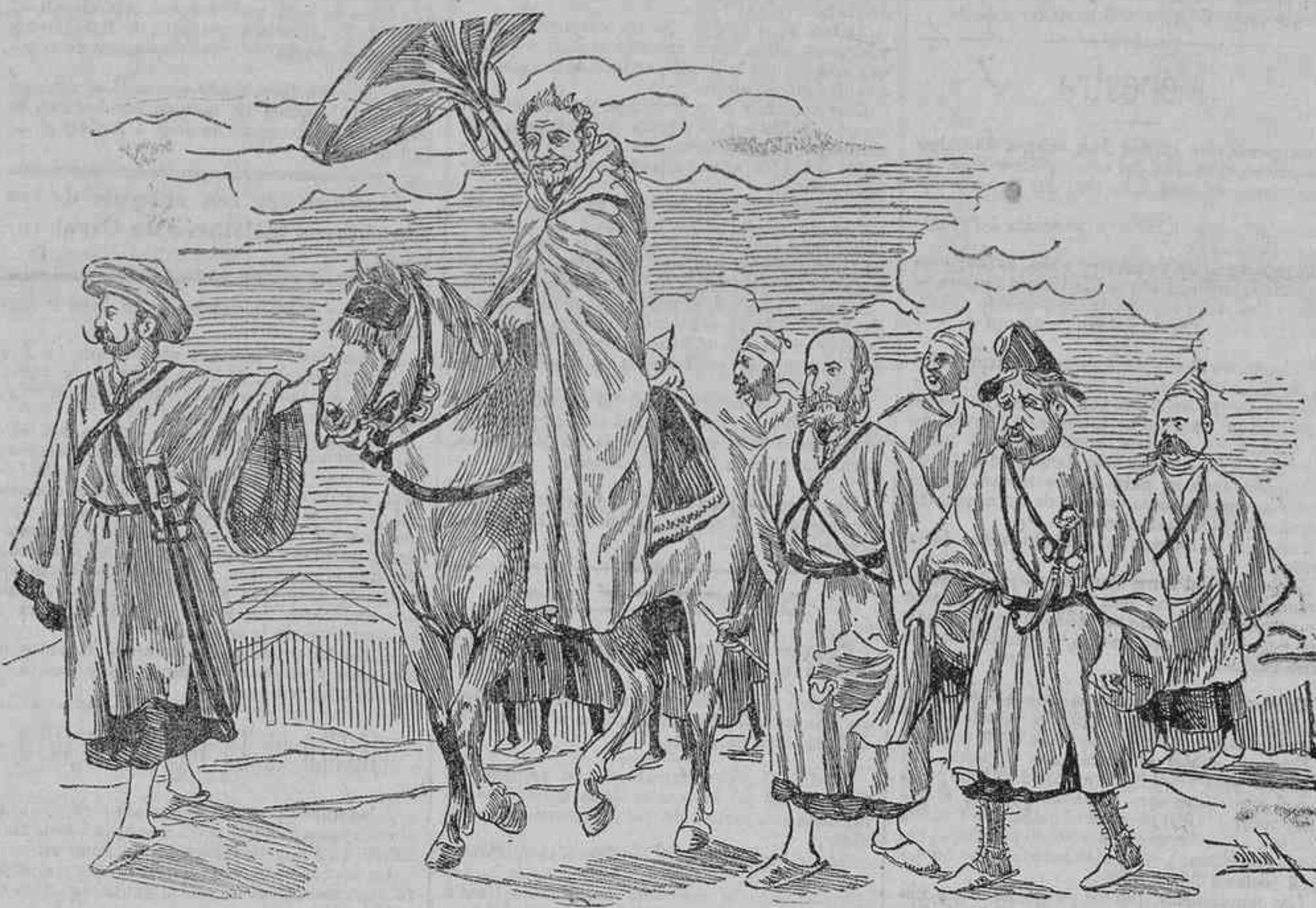
—Este es el enviado por Dios ¡oh aragoneses y catalanes! para llevar á vuestros oídos las teorías de la nación por y para sí misma. Escuchadle, reverenciado; coged los bártulos y venid con él y con nosotros. ¡Dios es Dios y Sagasta nuestro Padre! (Tres zalemas, un discurso por barba y nada entre dos platos.)

por nosotros sea un mal cierto, pero no tan grande, pues quien conozca á la indole distinta de las maniobras y de los combates de verdad, no se ha de alarmar como nosotros. Reconoce el colega que las deficiencias señaladas acusan falta de práctica en estos ejercicios y son censurables; pero añade que no se cometen en la guerra... «porque allí donde el enemigo tira y mata, la caballería se dispersa ó vuelve grupas, la compañía se ampara de las ondulaciones del terreno, el batallón despliega en guerrilla.»