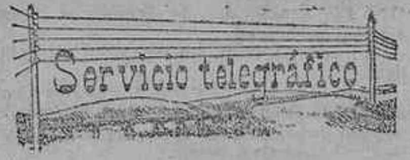
(De nuestro servicio particular.)

En Llorena. A pesar del satisfactorio estado de salud de aquella población, aún ocurren algunos casos. Ayer se registraron tres invasiones de benigno carácter.