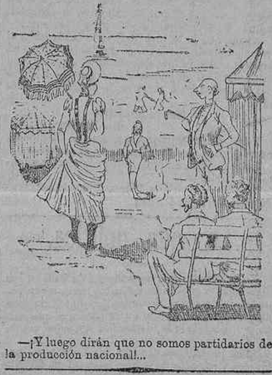
—Y luego dirán que no somos partidarios de la producción nacional...