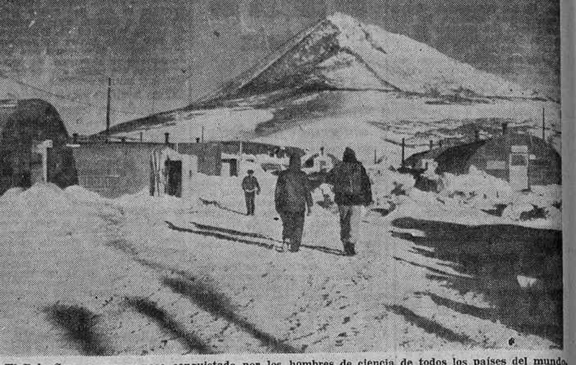
El Polo Sur es poco a poco conquistado por los hombres de ciencia de todos los países del mundo...

Si se fundiera el hielo allí acumulado, el nivel de los mares subiría en todo el mundo unos 55 metros sobre el actual