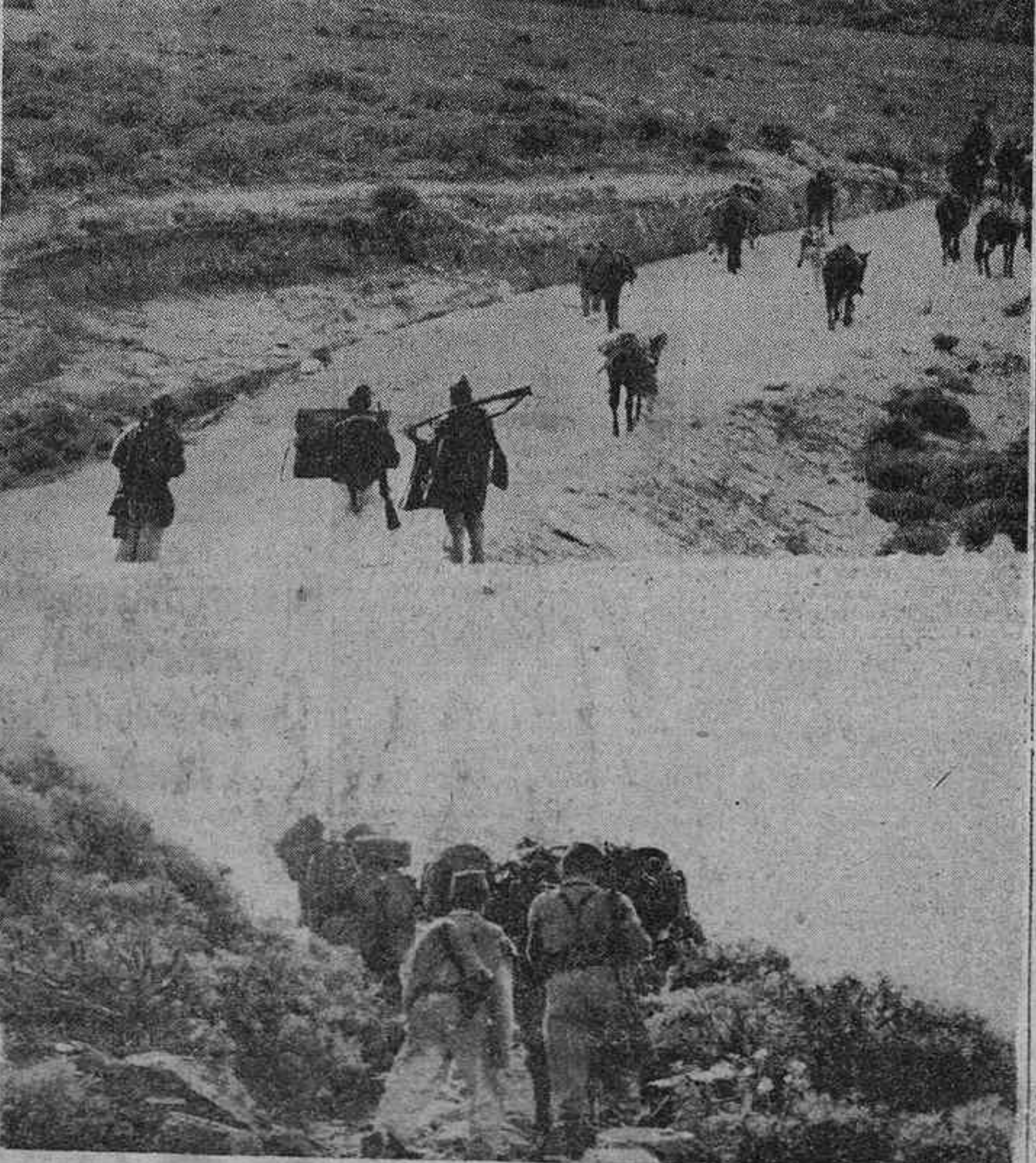
En la fotografía superior, fuerzas de la Legión en marcha por uno de los caminos del territorio de Ifni. En la inferior, los acemileros encargados del suministro de agua a un destacamento de tiradores de Ifni atraviesan un terreno plagado de arbustos, hasta llegar a la posición en que aquéllos, encargados de una operación de limpieza, han acampado.