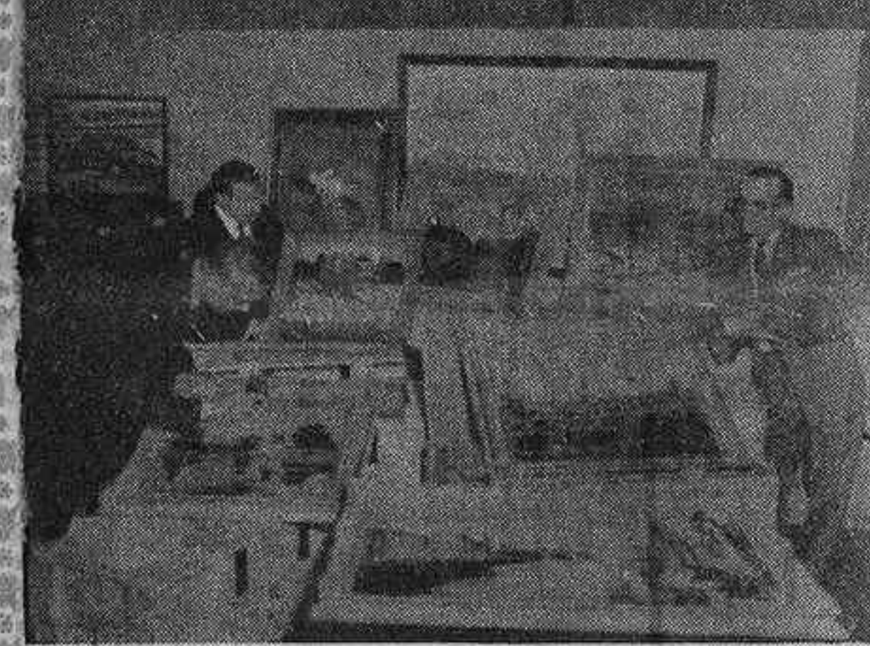
La obra pictórica de sir Wiston Churchill va a ser expuesta en las City. Se trata de 35 cuadros, cuyo valor se calcula en 40.000 dólares.