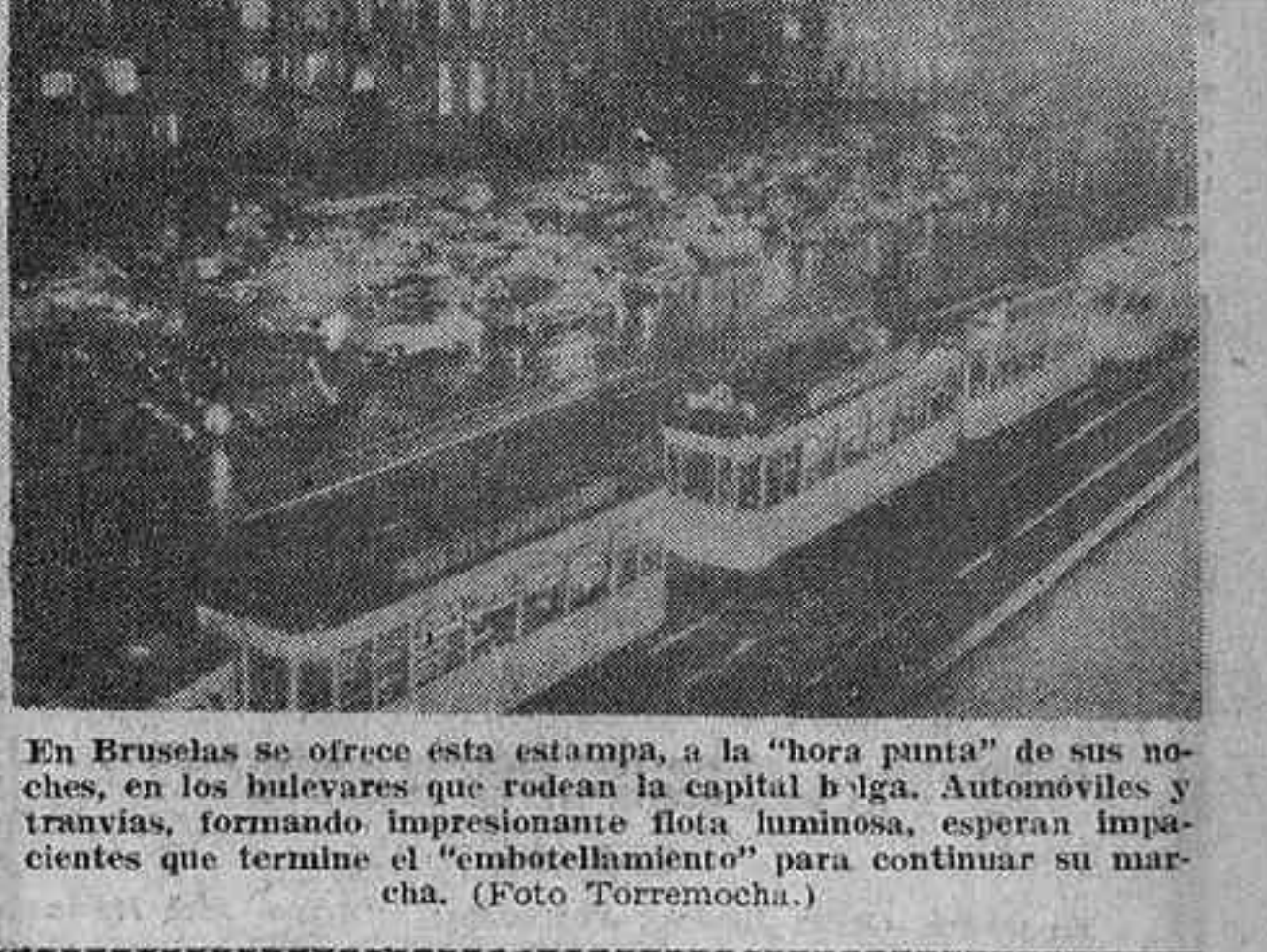
En Bruselas se ofrece esta estampa, a la "hora punta" de sus noches, en los bulevares que rodean la capital belga. Automóviles y tranvías, formando impresionante flota luminosa, esperan impacientes que termine el "embotellamiento" para continuar su marcha.