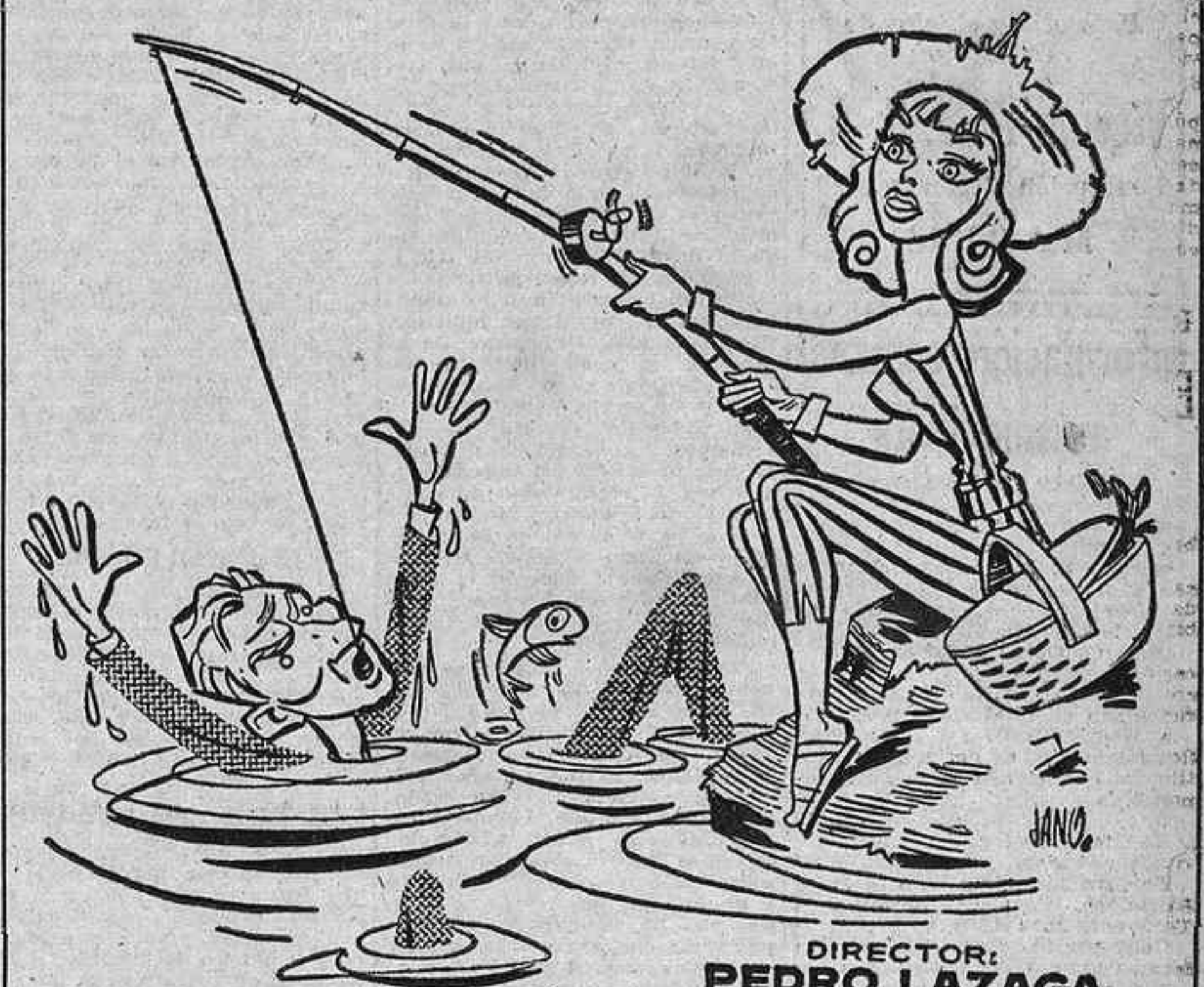
DIRECTOR: PEDRO LAZAGA EASTMANCOLOR • FILMASCOPE

ANALIA GADÉ FERNANDO FERNAN GÓMEZ TONY LEBLANC LICIA CALDERON ANTONIO OZORES VICKY LAGOS LUCIA PRADO Una historia escrita por: JOSÉ LUIS DIBILDOS y NOEL CLARASÓ LA ESTUPENDA HISTORIA DE UNAS MUCHACHAS ESTUPENDAS AUTORIZADA PARA MAYORES DE DIECISEIS AÑOS