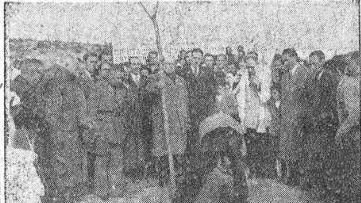
El presidente de la Diputación, marqués de la Valdivia, en el momento de plantar un árbol...

FUE INAUGURADO AYER Y TENDRA MAS DE DOS MIL ARBOLES