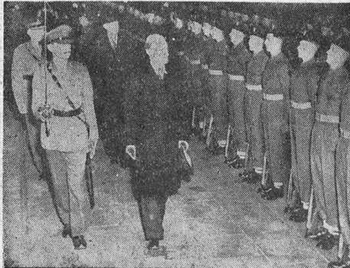
El ministro británico de Asuntos Exteriores, Mr. Eden, a su llegada al aeropuerto de Tempelhof, en Berlín, para asistir a la Conferencia de los cuatro, que comienza hoy lunes.

BERLÍN, 24.—Los aliados occidentales y la U. R. S. S. comienzan mañana lunes su primera conferencia de ministros celebrada de cinco años acá, pero con puntos de vista tan diametralmente opuestos, que no hay sino muy remotas esperanzas de acuerdo. El órgano del Partido de Unidad Socialista, "Neues Deutschland", ha lanzado hoy un virtual ultimátum a los occidentales para que abandonen la Comunidad Defensiva Europea si quieren que tenga éxito la conferencia de Berlín. "La insistencia de Foster Dulles en crear un Ejército alemán occidental—dice el periódico—no sólo hace imposible el acuerdo, sino que excluye todas las probabilidades de que pueda llegarse a un pacto de seguridad que disminuya la tirantez internacional." Por su parte, "Taegliche Rundschau", portavoz del Ejército soviético en Alemania, insiste en subordinar los problemas para que se abra la conferencia a la conferencia Alemania-Austria, según franca y reiterada declaración de los occidentales—"a la necesidad de una conferencia pentapartita para poner fin a la situación de opresión que algunas naciones europeas de la Comunidad Defensiva se hallan con respecto a otras naciones del continente".—EPE. La reunión comienza a las tres de la tarde BERLÍN, 24.—Los rusos han da-