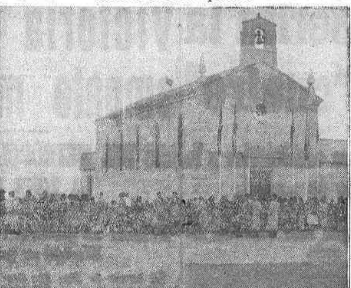
Fachada de la Iglesia de San Carlos, en la barriada de Entrevías, en el Puente de Vallecas, que el domingo fué bendecida por el obispo auxiliar doctor Ricote.

Las obras, realizadas por Regiones Devastadas, han costado 600.000 pesetas