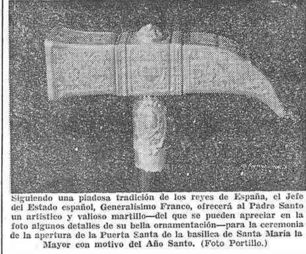
Seguiente una piadosa tradición de los reyes de España, el Jefe del Estado español, Generalísimo Franco, ofrecerá al Padre Santo un artístico y valioso martillo—del que se pueden apreciar en la foto algunos detalles de su bella ornamentación—para la ceremonia de la apertura de la Puerta Santa de la basílica de Santa María la Mayor con motivo del Año Santo.

SE CALCULAN EN CASI UN MILLON DE ALMAS LAS MUCHEDUMBRES QUE PRESENCIARAN LA APERTURA DE LAS PUERTAS SANTAS