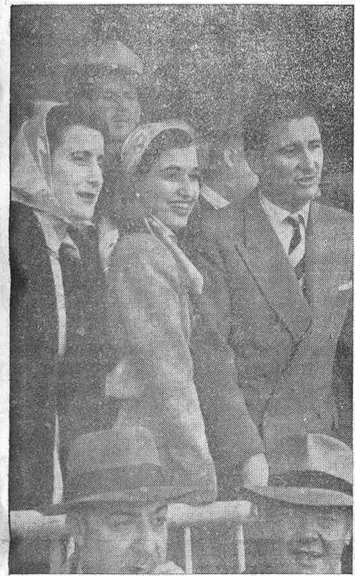
La señorita Carmen Franco Polo, hija de Su Excelencia el Jefe del Estado, acompañada de su prometido, don Cristóbal Martínez Bordiu, marqués de Villaverde, en la tribuna del campo de Madrid en uno de los últimos festivales deportivos.

PARA EL DOCTOR EN MEDICINA DON CRISTOBAL MARTINEZ BORDIU, MARQUES DE VILLAVERDE