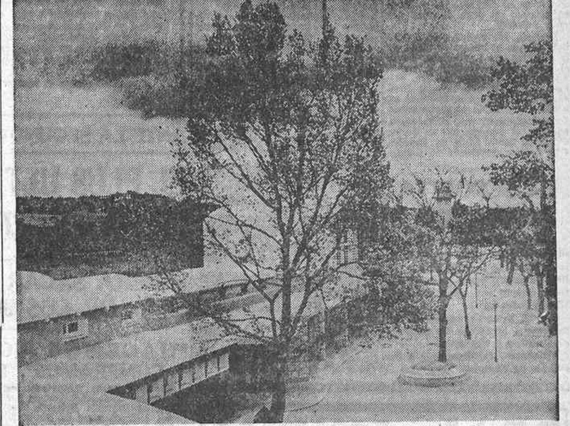
Un aspecto del parque deportivo de Educación y Descanso, que se inaugurará mañana

LOS TRABAJADORES SOLO PAGARAN DE CUOTA 12 PESETAS AL AÑO