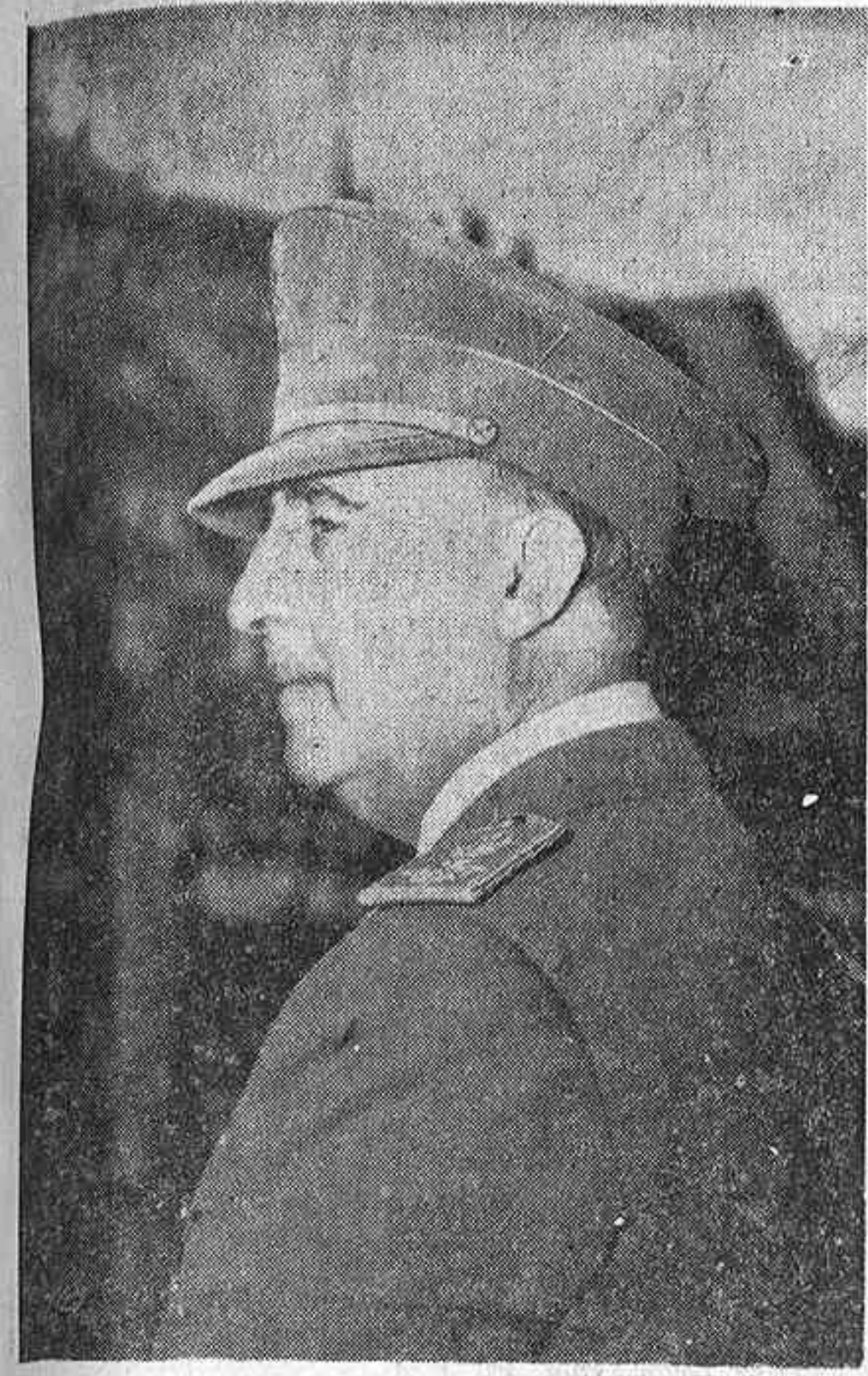
FRANCO, CAUDILLO DE ESPAÑA