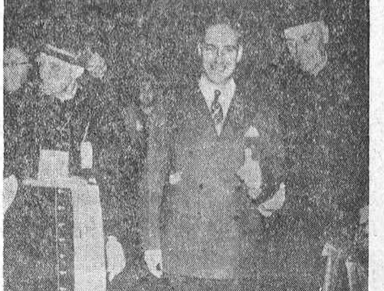
El cardenal Caro llega a la capital brasileña para asistir al Congreso Eucarístico Internacional. Acompaña al ilustre purpurado el embajador de su país, don Raúl Bazán, y el cardenal Barros Câmara.