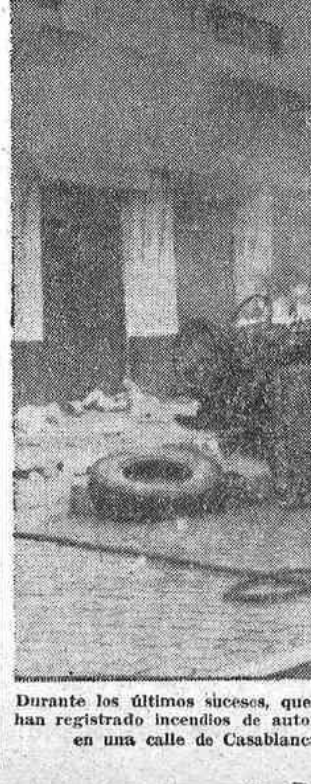
Durante los últimos sucesos, que han creado una situación dramática en el Marruecos francés, se han registrado incendios de automóviles en plena vía pública...