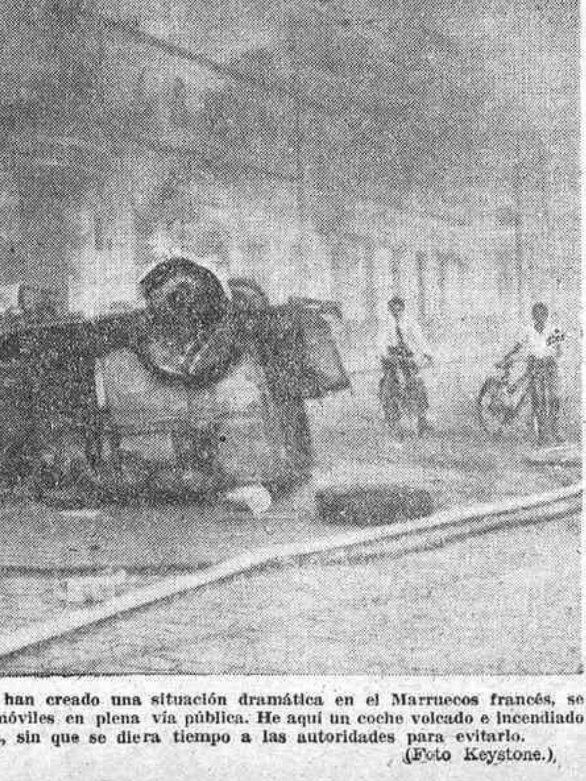
Durante los últimos sucesos, que han creado una situación dramática en el Marruecos francés, se han registrado incendios de automóviles en plena vía pública...