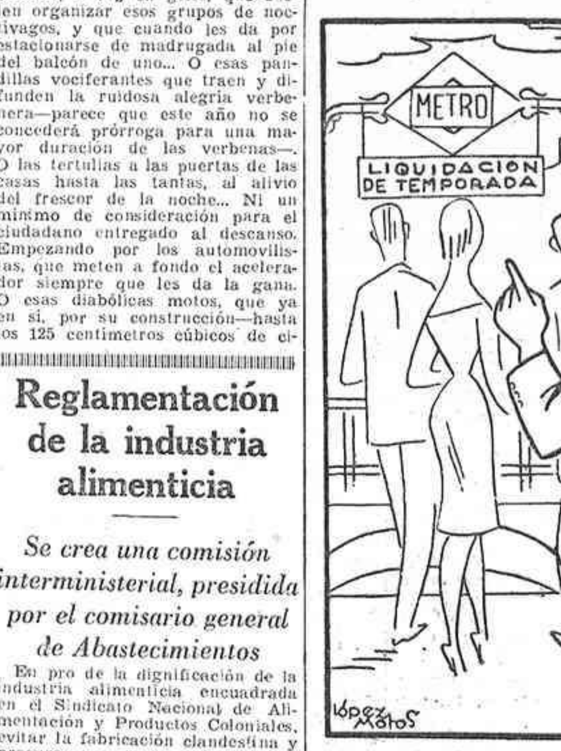
—Vengo sudando de Ventas y se me ha ocurrido poner ese cartelito.