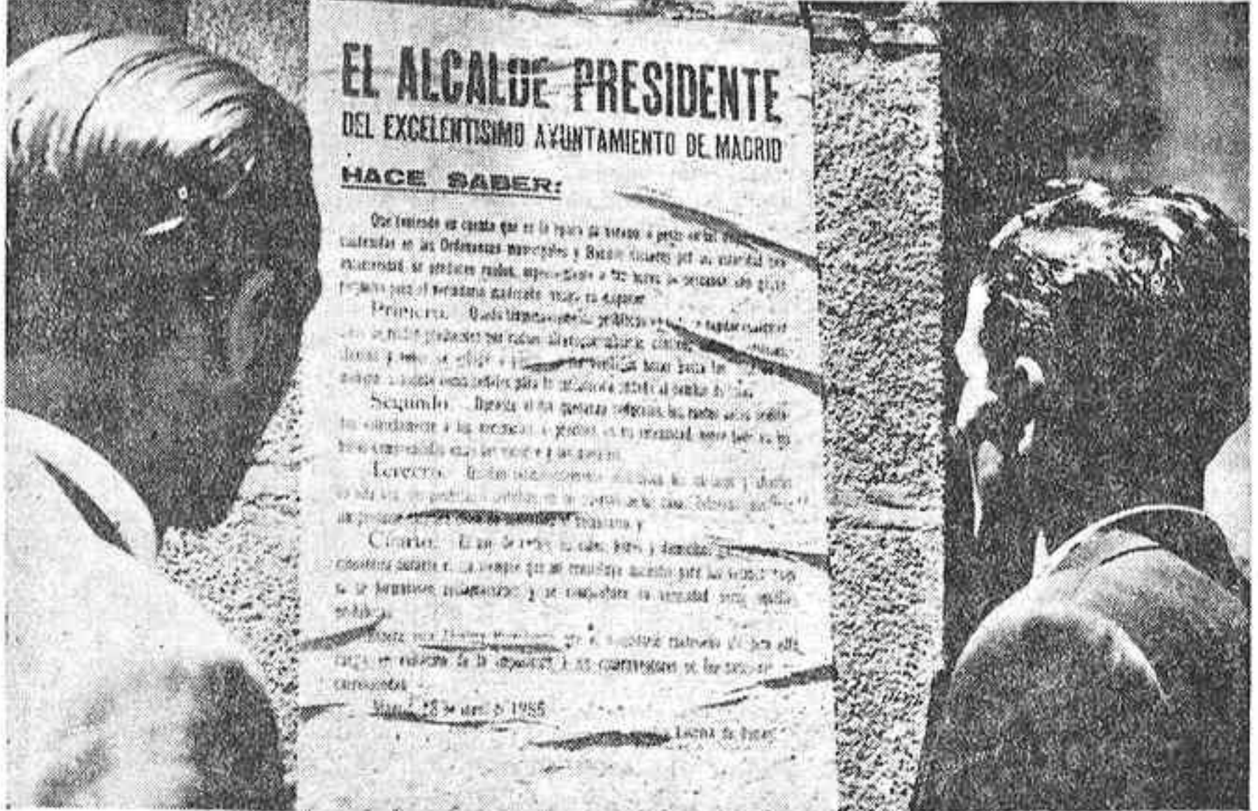
"De orden del señor alcalde...". Si se prohíben los ruidos molestos y los gamberros y estridor urbano suelen ir asociados. Hay que leer el bando, como hacen estos dos señores, puesto que el incumplimiento de cuanto en él se ruega y manda será severamente castigado. Y que no les valdrá a los contraventores alegar ignorancia de tales disposiciones, salvaguardia de la salud y la tranquilidad del vecindario madrileño.