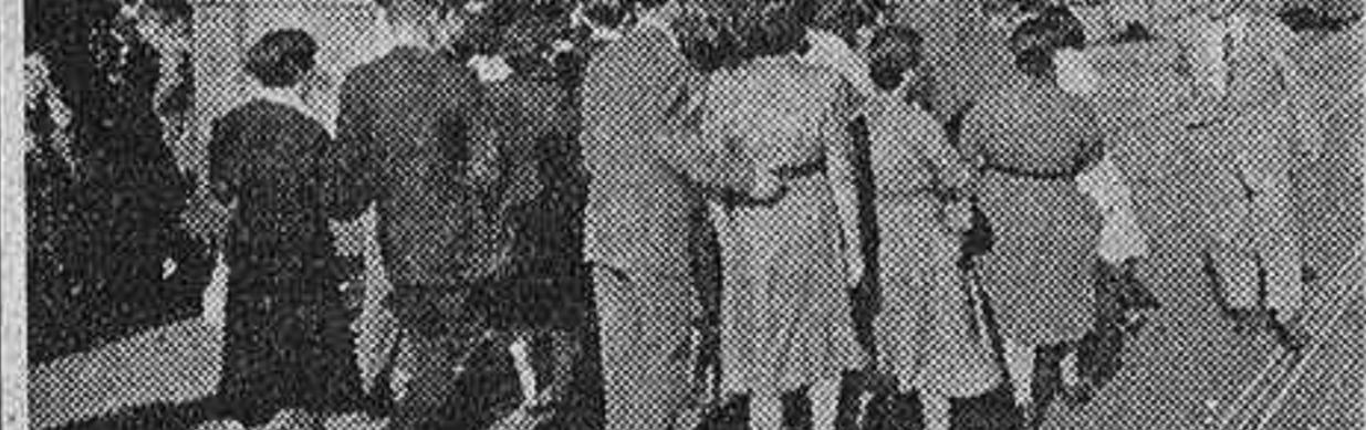
Por reciente acuerdo del Ayuntamiento de Madrid, la línea de tranvías de las Ventas, cuya explotación correspondía a una empresa privada, ha pasado a la pertenencia de la Corporación municipal. La foto recoge un aspecto de la parada de dicho tranvía en la plaza de las Ventas. (Foto Cifra).

El Ayuntamiento de Madrid y la Compañía Madrileña de Urbanización estudian estos días el traspaso de los servicios tranviarios de aquella empresa a la Municipal de Transportes. La necesidad de este traspaso viene impuesta por la anexión de los puentes inmediatos a la capital, y supone un aumento de 21 kilómetros y 198 metros sobre los 227 kilómetros y 67 metros de longitud total que tienen las 28 líneas de tranvías, las 13 de autobuses y las tres de trolebuses actualmente en servicio en la capital.