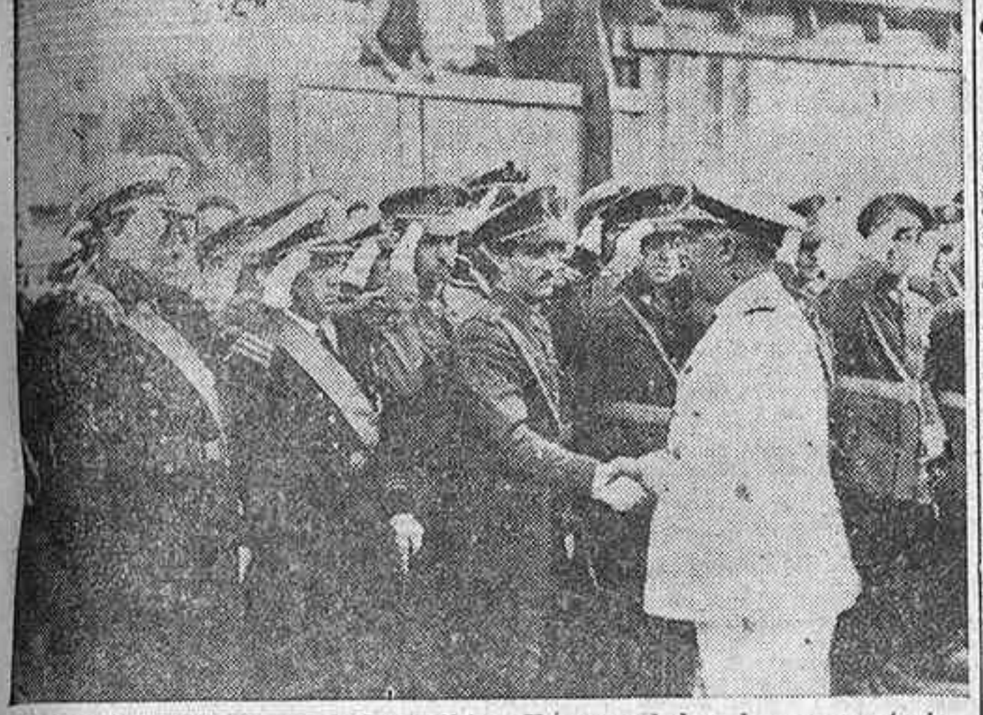
El jefe del Estado español, Generalísimo Franco, saluda a las representantes de las guardias de San Sebastián que acudieron a recibirle a su llegada a la bella capital guipuzcoana, donde el Caudillo se propone pasar una breve temporalidad de descanso.

PASEO POR LA BAHIA, A BORDO DEL "AZOR", Y EXCURSION A ALTA MAR