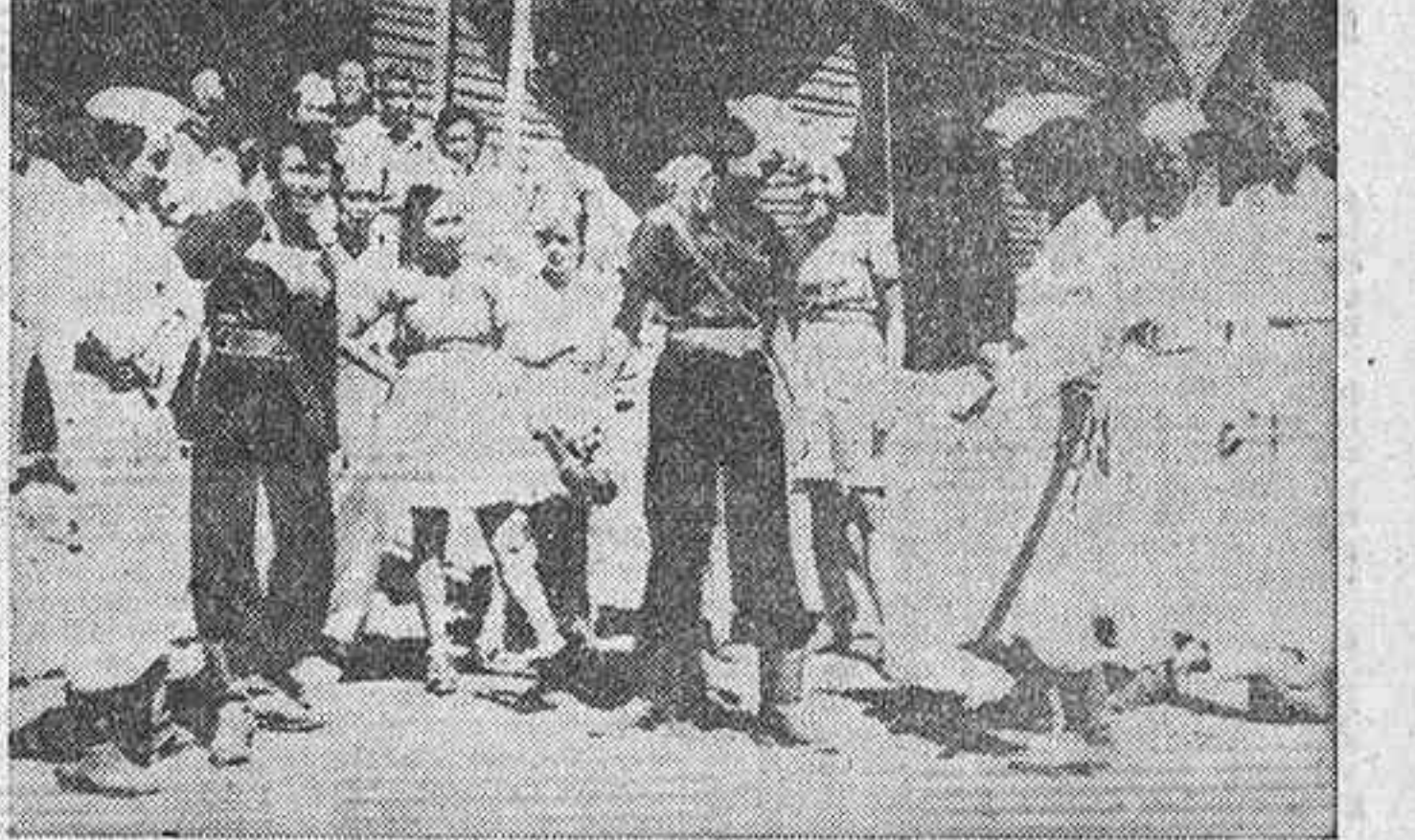
He aquí algunos miembros del ejército de Indonesia, muchos de los cuales se dejan crecer el pelo, después de haber jurado no volvérselo a cortar, en tanto no hayan conseguido por sus islas una completa independencia.

Han sido puestos en libertad los tres dirigentes republicanos que se hallaban detenidos