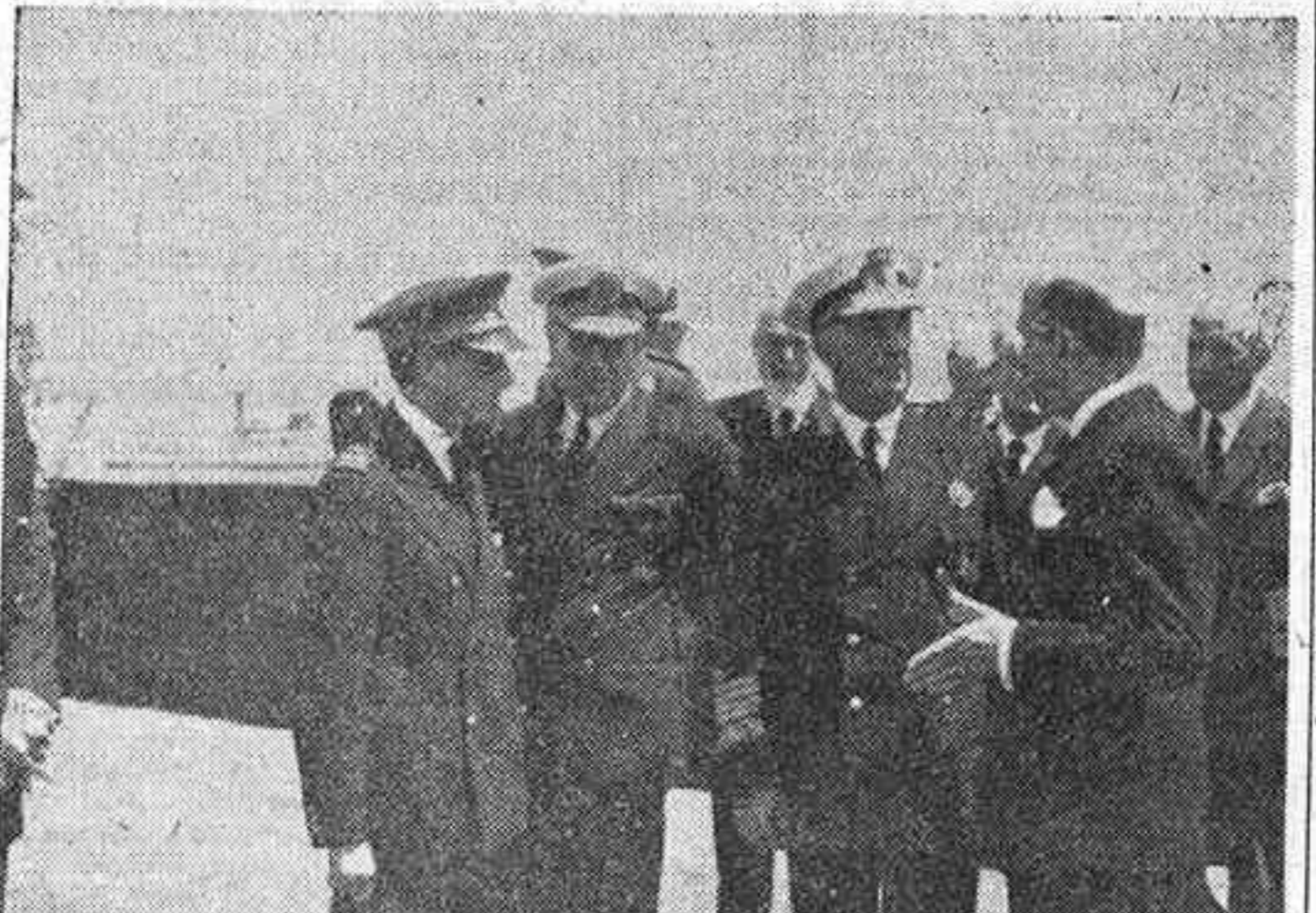
Su Excelencia el Jefe del Estado, acompañado del ministro de Industria y Comercio, así como del delegado del Gobierno e ingenieros del puerto franco de Barcelona, examina, durante la visita que el sábado efectuó, los planos de las obras de ampliación recientemente iniciadas.

BARCELONA, 25.—Su Excelencia el Jefe del Estado permaneció durante toda la mañana de hoy en su residencia del palacio de Pedralbes. Oyó misa en la intimidad en la capilla del citado palacio.—CIFRA.