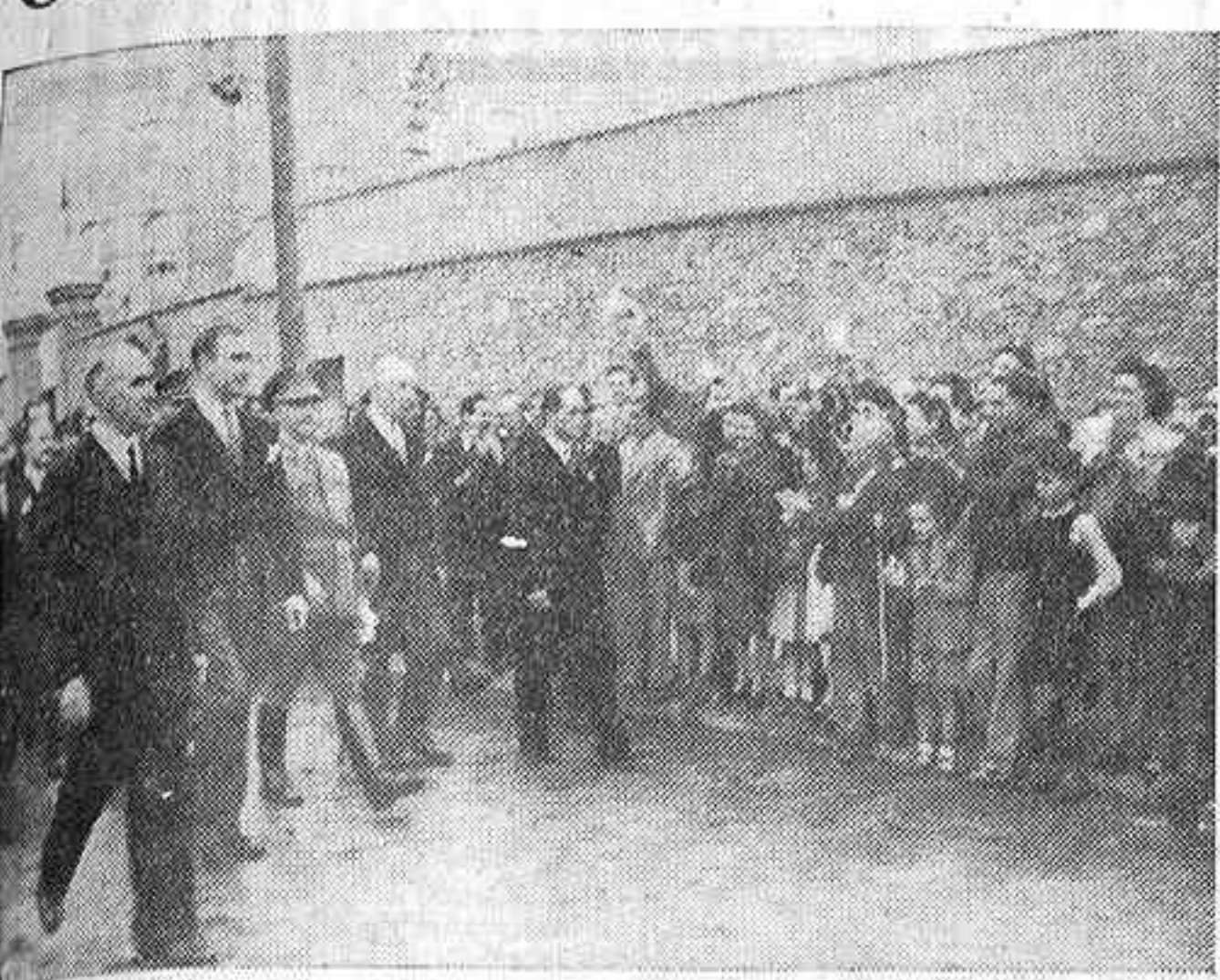
La población de la barriada obrera barcelonesa de San Andrés recibe al Caudillo con grandes aclamaciones durante la visita que efectuó a la citada barriada.