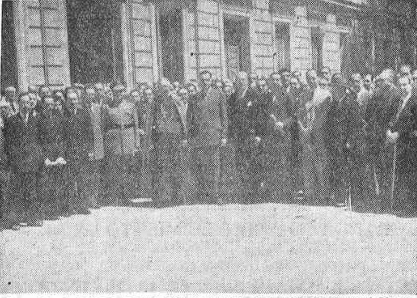
Grupo de asistentes a la Asamblea nacional de Formación Profesional Obrera, a la salida del antiguo palacio del Senado...

Fué elegido presidente de honor el arzobispo de Valencia, hijo de obrero