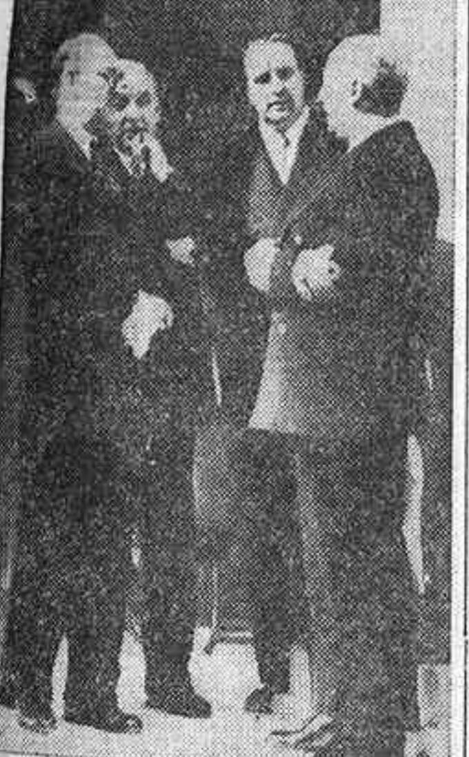
Su Excelencia el Jefe del Estado con los ministros de Asuntos Exteriores, Educación Nacional y Obras Públicas, momentos antes de dar comienzo el Consejo celebrado en el palacio de Pedralbes.

Si os dijera que me llevo a Barcelona prendida en el corazón os diría poco. Vuestra gentileza, vuestra amabilidad, el calor de este pueblo barcelonés me han cautivado. Es la tierra de Cataluña tierra pródiga y generosa, como lo ha demostrado con el entusiasmo y el afecto que desde mi llegada me viene ofreciendo, y tan trabajadora que, en contraste con el abandono casi secular que en España se tuvo a la economía, todo se lo debe a su propio esfuerzo.