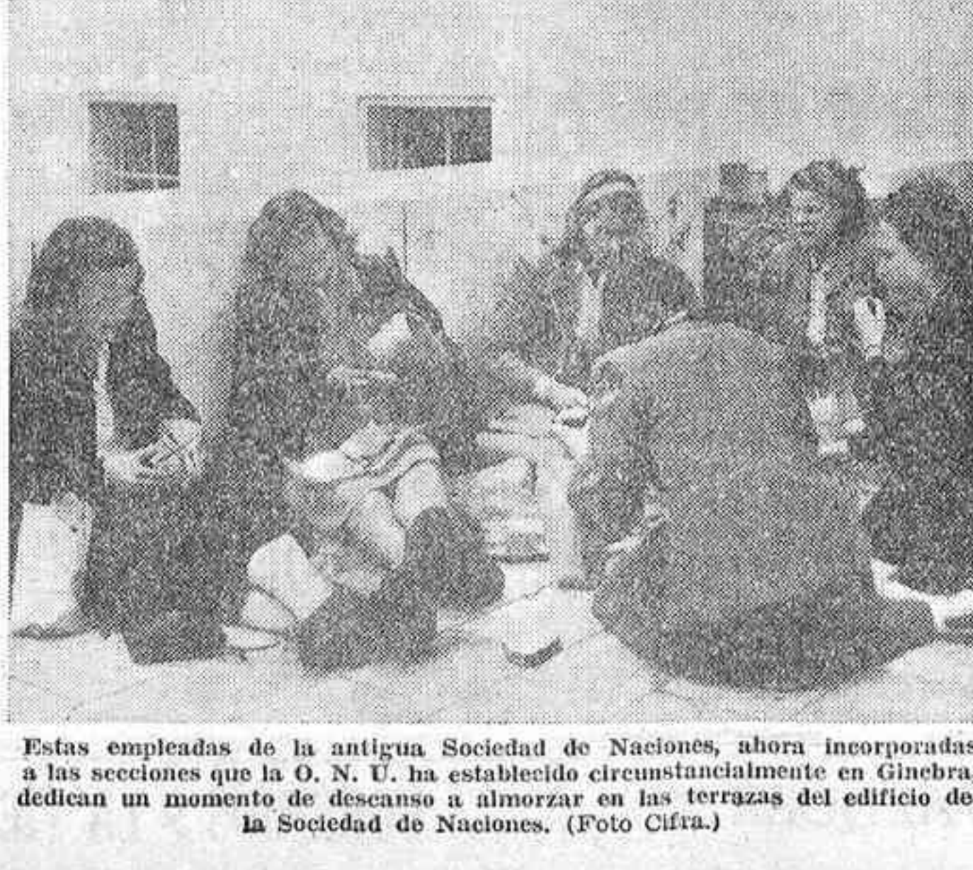
Estas empujadas de la antigua Sociedad de Naciones, ahora incorporadas a las secciones que la O. N. U. ha establecido...