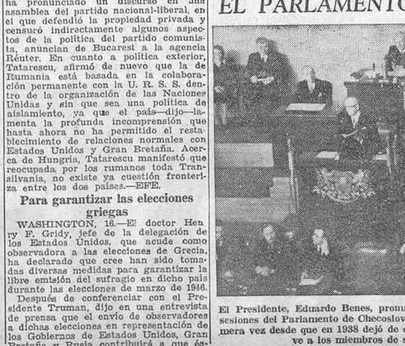
El Presidente, Eduardo Benes, pronuncia el discurso de inauguración de las sesiones del Parlamento de Checoslovaquia, que ha vuelto a funcionar por primera vez desde que en 1938 dejó de existir la República. Delante de Benes se ve a los miembros de su Gobierno.