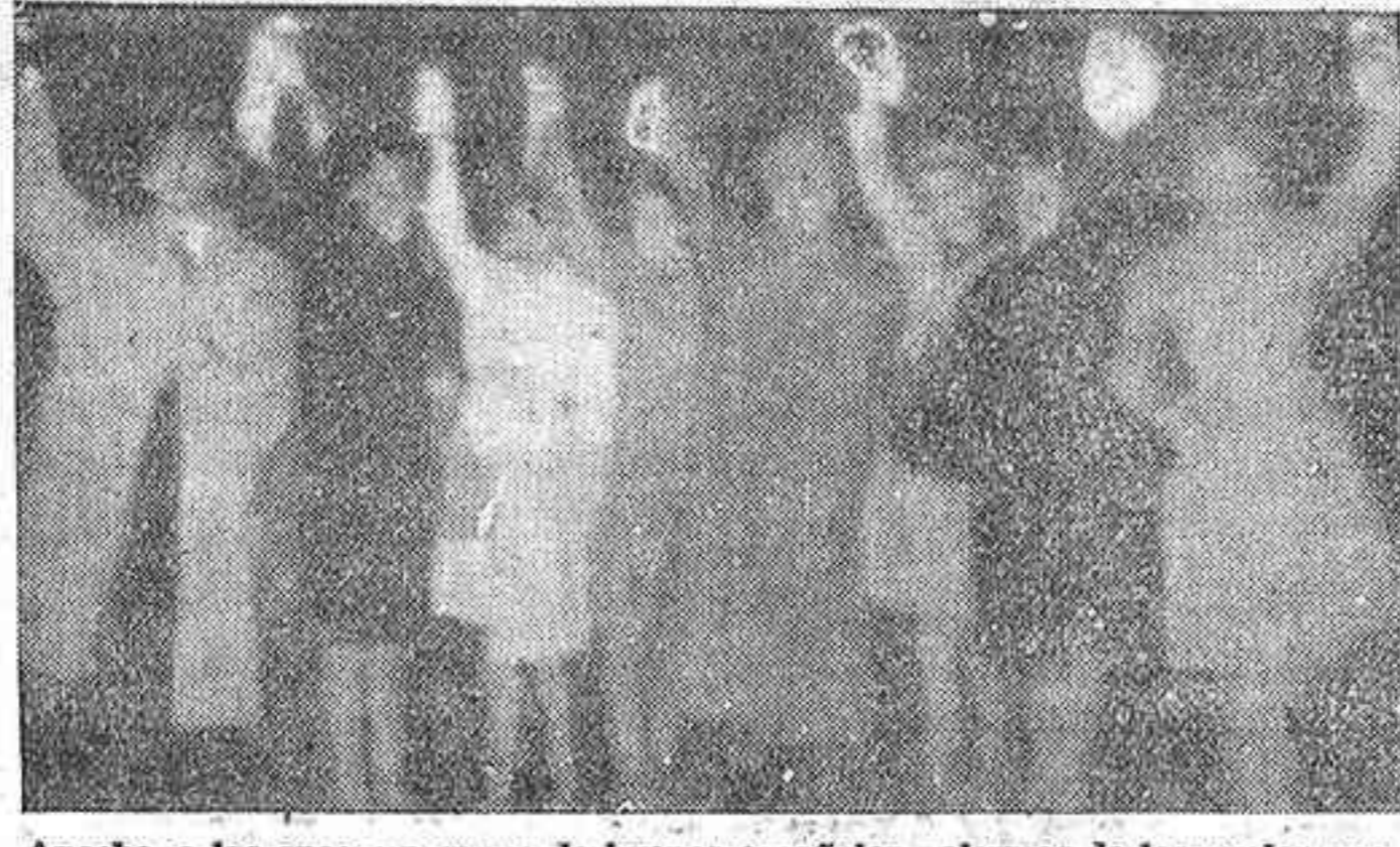
Anoche, a las once, un grupo de buenos españoles—algunos de los cuales aparecen en este grabado—tomaron los primeros puestos para la manifestación de protesta que hoy ha de recorrer las calles de Madrid. Su fervor español es anuncio, sin duda, del que ha de empujar en la mañana de hoy a cientos de miles de españoles en la unidad rotunda de la Patria y de Franco.