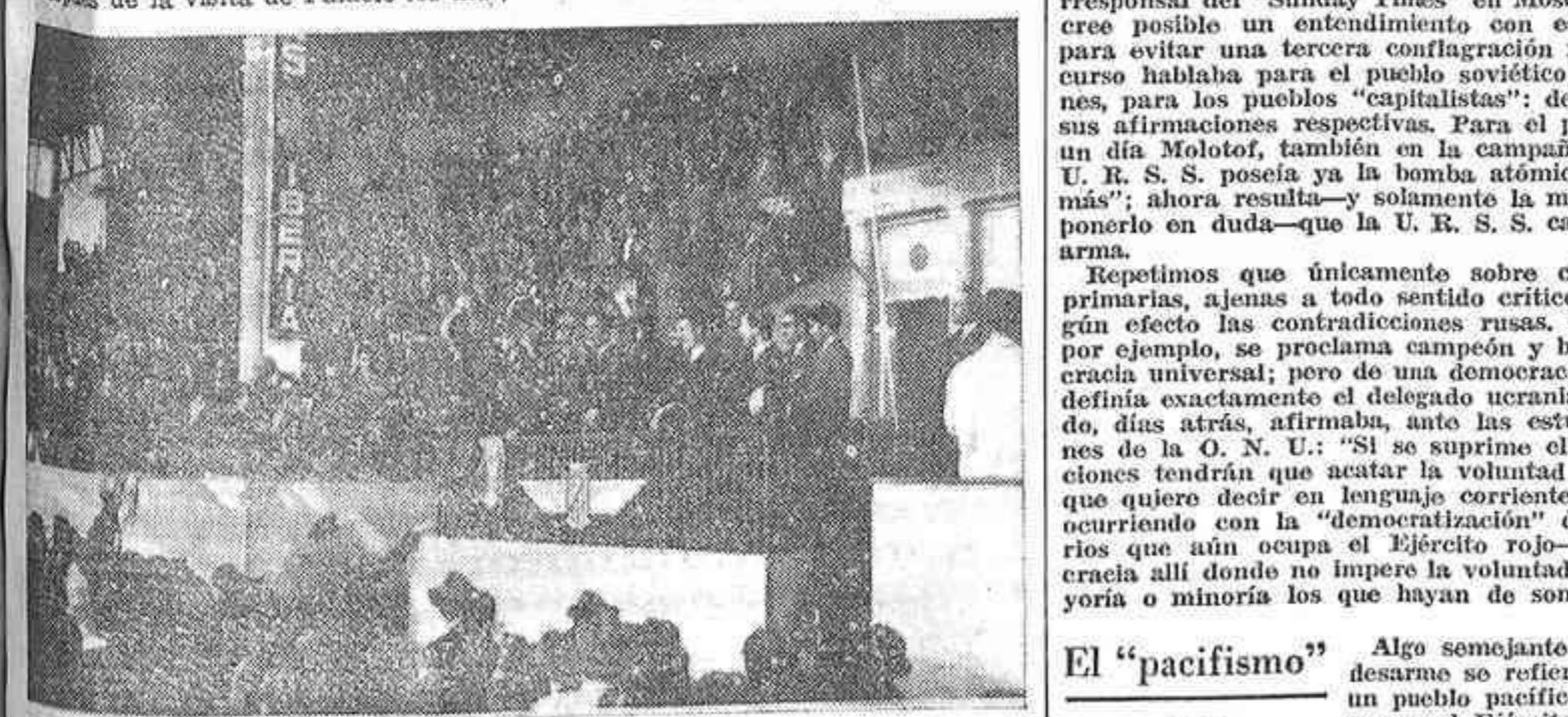
Un grupo de guardias marinas argentinos, que presenciaron ayer tarde en el Estadio el partido entre el Madrid y el Gijón, son objeto de una calorosa ovación por parte del público, a la que ellos corresponden gentilmente.