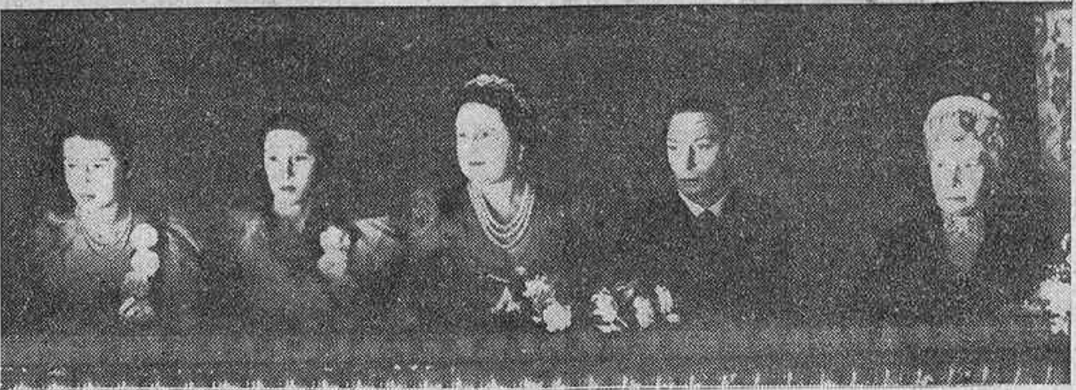
En Londres se han reanudado, con asistencia de la familia Real, las tradicionales funciones de ópera del Covent Garden, suprimidas desde el comienzo de la guerra. He aquí, en la función inaugural, el palcos regios, con los Reyes Jorge VI e Isabel, la Reina Mary, madre del Monarca, y las princesas Isabel y Margarita.