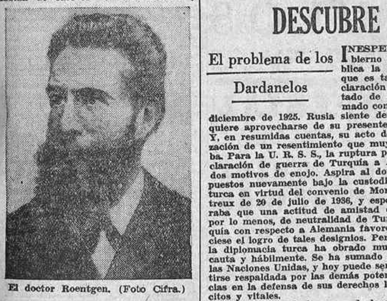
El doctor Roentgen.

Coincide este año la conmemoración de dos fechas importantísimas en la historia de la Física y de la Medicina moderna: el centenario del nacimiento del inventor de los rayos X y el cincuentenario de su descubrimiento. Mañana—27 de marzo—hace un siglo que nació Guillermo Federico Roentgen, quien, cincuenta años después veía premiados los esfuerzos de una vida dedicada al estudio con el hallazgo de unos rayos que tenían la propiedad de atravesar la mayor parte de los cuerpos. Modestamente los denominó "X", desechando la idea de numerosos amigos y hombres de ciencia que quisieron llamarlos Roentgen, con el apellido del inventor.