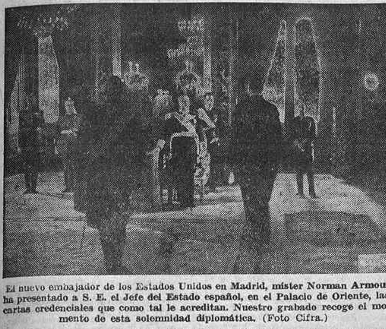
El nuevo embajador de los Estados Unidos en Madrid, mister Norman Armour, ha presentado a S. E. el jefe del Estado español, en el Palacio de Oriente, las cartas credenciales que como tal le acreditan. Nuestro grabado recoge el momento de esta solemnidad diplomática.