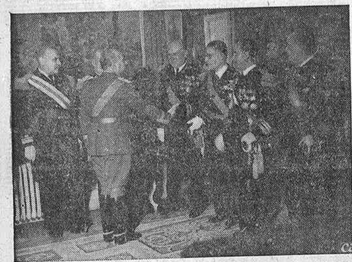
El Caudillo recibiendo las felicitaciones de los altos jefes de los ejércitos de Tierra, Mar y Aire con motivo de la Pascua militar.