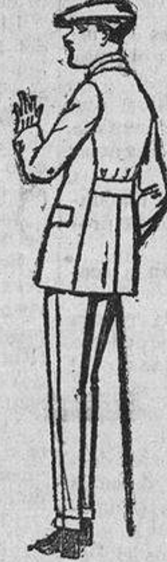
Trajes modelo Sport de lanilla, melton, etc., para juveniles de diez a diez y seis años. De ptas. 37 a 90. El mismo modelo, en dril listado, crudo o kaki. De ptas. 25 a 42