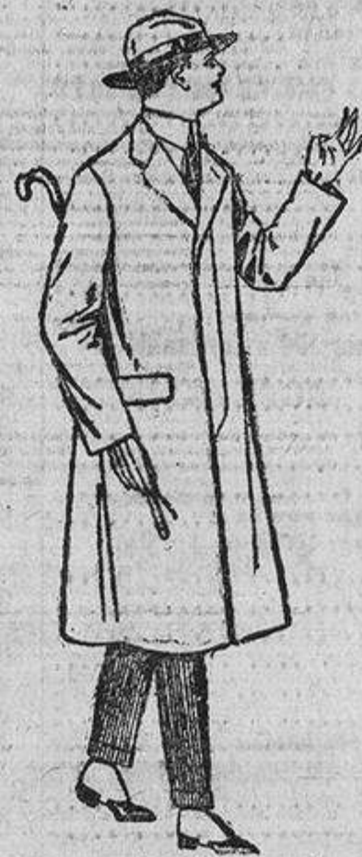
Gabanes de cheviot, melton, etc., con forro seda o satén. De ptas. 52 a 200.

SUCURSALES: Barcelona, Alicante, Almería, Cádiz, Bilbao, Cartagena, Gijón, Málaga, Palma de Mallorca, Granada, Santander, Sevilla, Valencia, Valladolid y Zaragoza.