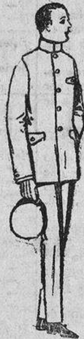
Trajes de vicuña azul o estambre gris, para grooms de 10 a 15 años. De ptas. 45 a 80. Los mismos, con pantalón breeches. De ptas. 47 a 80.