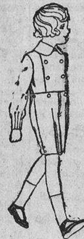
Trajes de vicuña o estambre azul, para niños de 3 a 7 años. De ptas. 25 a 30. Los mismos, de dril liso. De ptas. 10 a 15

Ropas confeccionadas para caballero, señora, niño y niña.