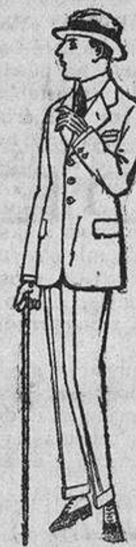
Trajes de vicuña azul o estambre gris, para juveniles de diez a diez y seis años. De ptas. 30 a 90. Trajes de dril listado, crudo o kaki. De ptas. 23 a 42.