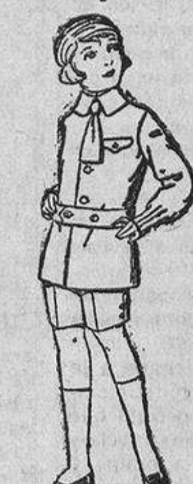
Trajes de lanilla, melton, etc., para niños de cuatro a nueve años. De ptas. 15 a 25. Los mismos, de dril also o listado. De ptas. 11 a 15.

Boas, Camisería, Géneros de punto, Corbatería, Guantería, Sombrerería, Zapatería, Bastones, Paraguas, Sombrillas y Artículos de viaje.