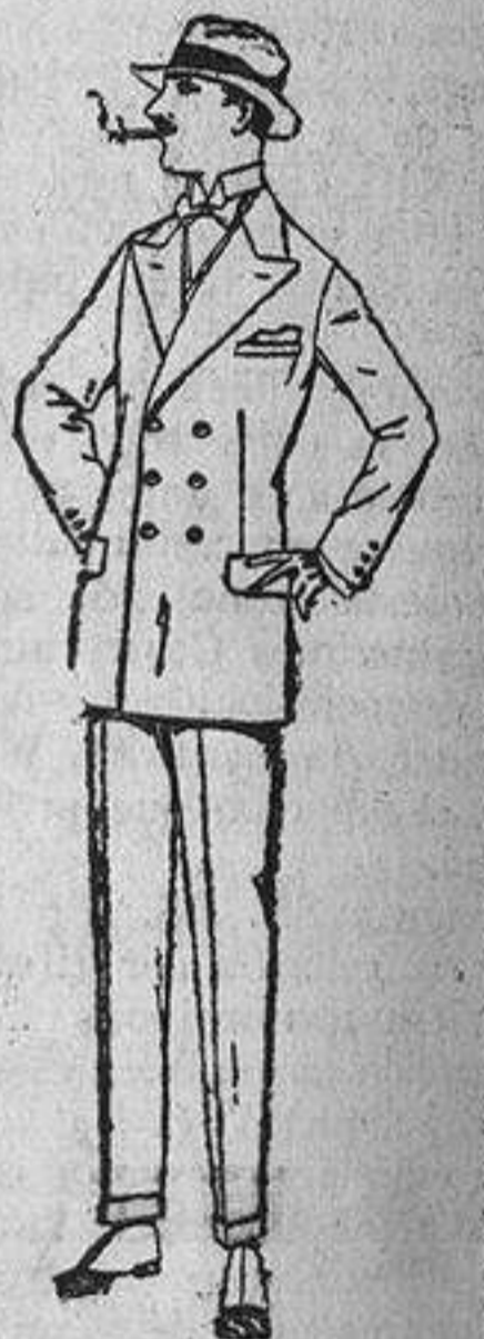
Trajes de lanilla, melton, estambre, vicuña o jerga. De ptas. 40 a 150. Trajes de dril crudo, kaki o listado. De ptas. 28 a 60.