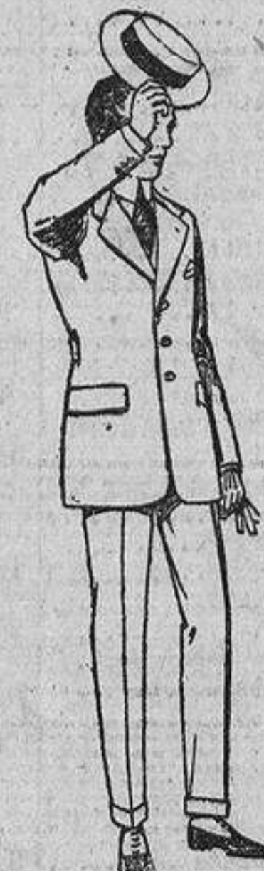
Trajes modelo sport, de lanilla, melton, etc. De ptas. 52 a 125. En dril beige, kaki o verdoso. De ptas. 30 a 60.