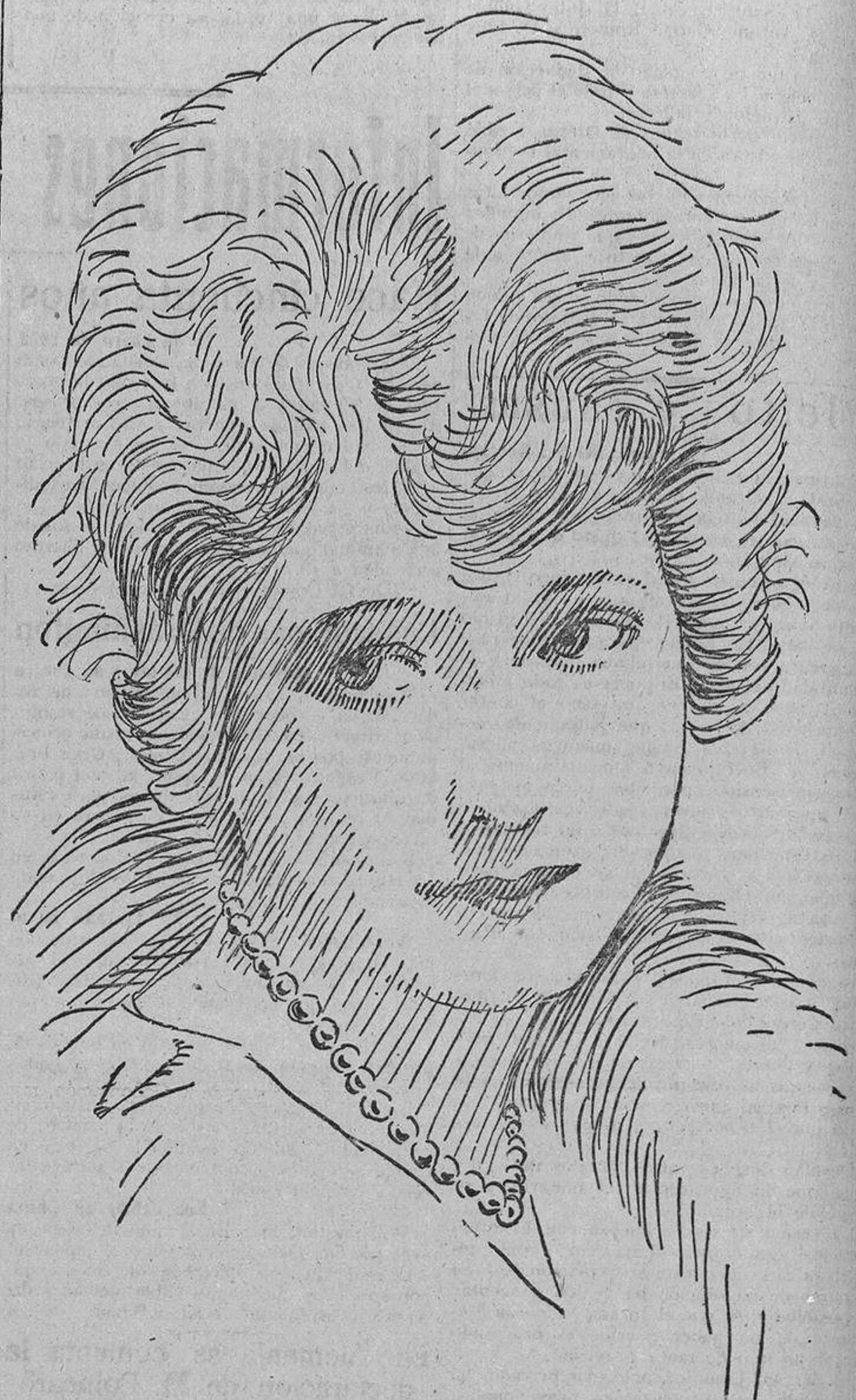
MAY AVOY, que cuenta sólo veinte años de edad, y que al segundo año de actuar ante el objetivo es ya una de las más eminentes artistas americanas