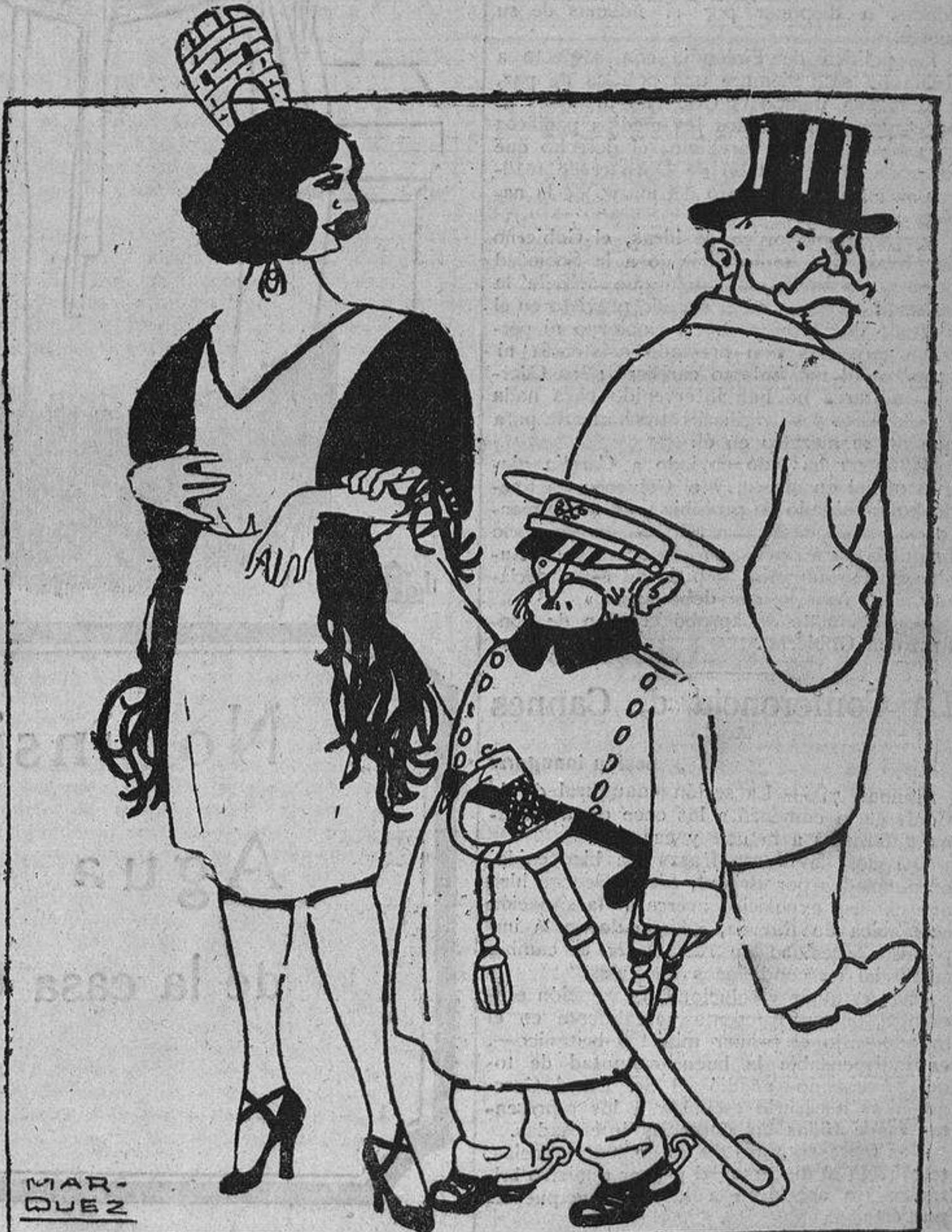
«Es mi hombre».