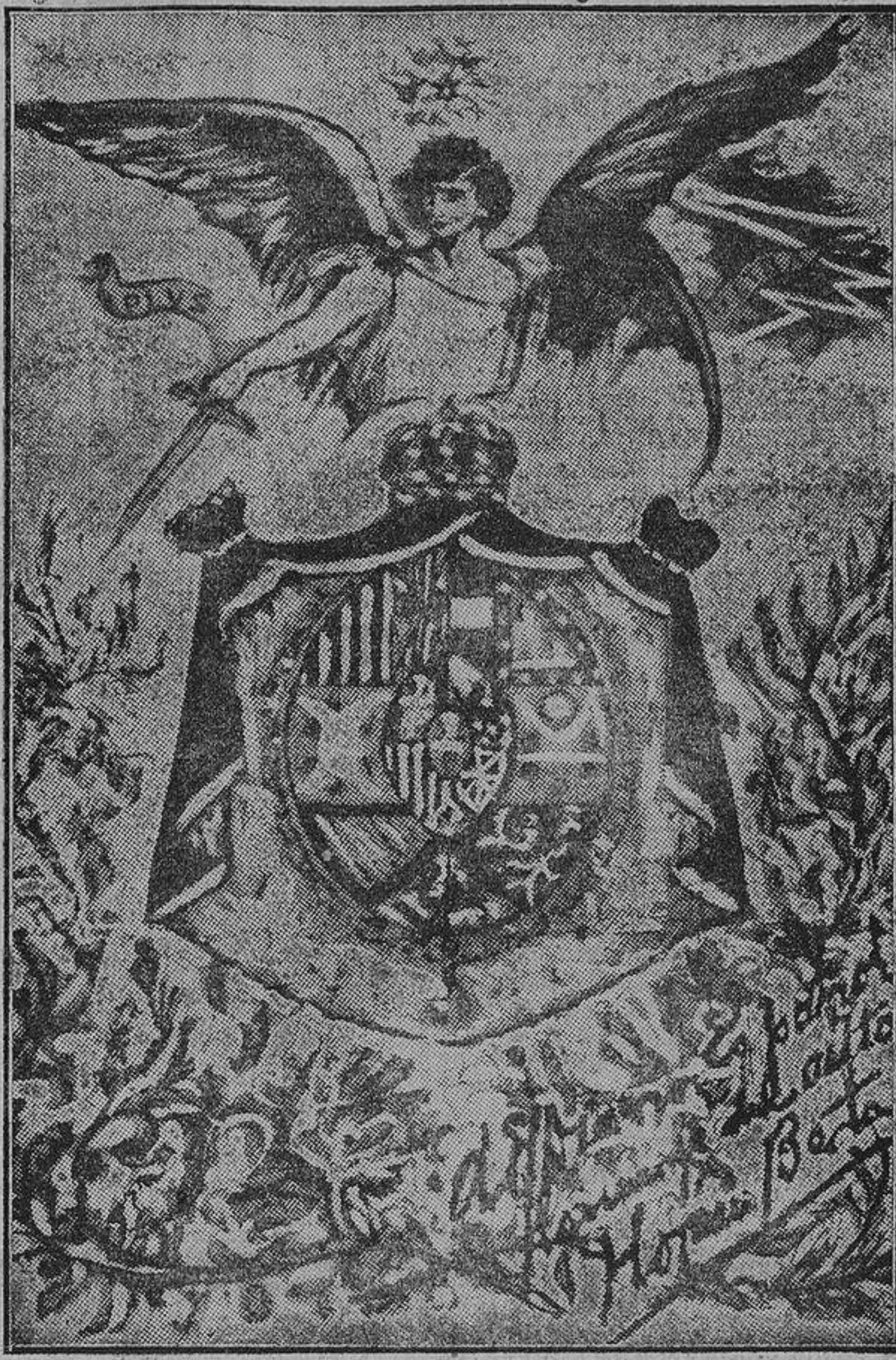
Portada del álbum dedicado al general Primo de Rivera, original del eminente dibujante Horacio Berta

Un grupo caracterizado de españoles, radicados en Montevideo y en la Argentina, que ha visto con agrado la labor iniciada por el general Primo de Rivera, ha resuelto obsequiar a dicho compatriota, en nombre de la colectividad, con un precioso álbum que llevará las firmas de las personalidades de la banca, comercio e industrias españolas, etc., etc., como merecido homenaje a su gestión administrativa.