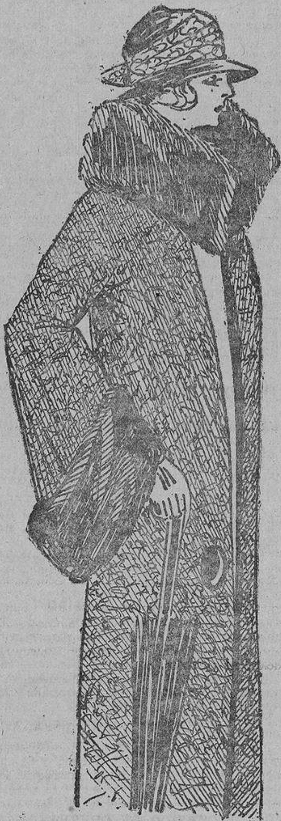
Abrigo de terciopelo estampado y adornado con piel en el cuello y mangas

«Llegará el día en que las mujeres de Norteamérica estén tan familiarizadas con el boxeo, como lo están hoy día con el «basketball»—predice ella—. Es un ejercicio físico muy importante, al cual todavía la mujer no le ha dedicado verdadera atención. El prejuicio que tienen contra ese deporte se desvanecerá en cuanto se convengan de que no las hace menos femeninas o menos artísticas. Yo no soy lo que se puede llamar una emancipada, y me agrada todo lo bello, especialmente los trajes bonitos, y he sido durante varios años una experta en cuestiones de arte. Mis gustos sienten predilección por el estilo de Luis XV. Si yo no fuera boxeadora, sería una cantante de conciertos. Pero eso no impide que yo trate de conservar mi cuerpo fuerte y saludable. En lugar de hacerme despreciar las modalidades artísticas de la vida, el boxeo, la cultura del músculo ha aumentado mi interés por esas cosas del espíritu.»