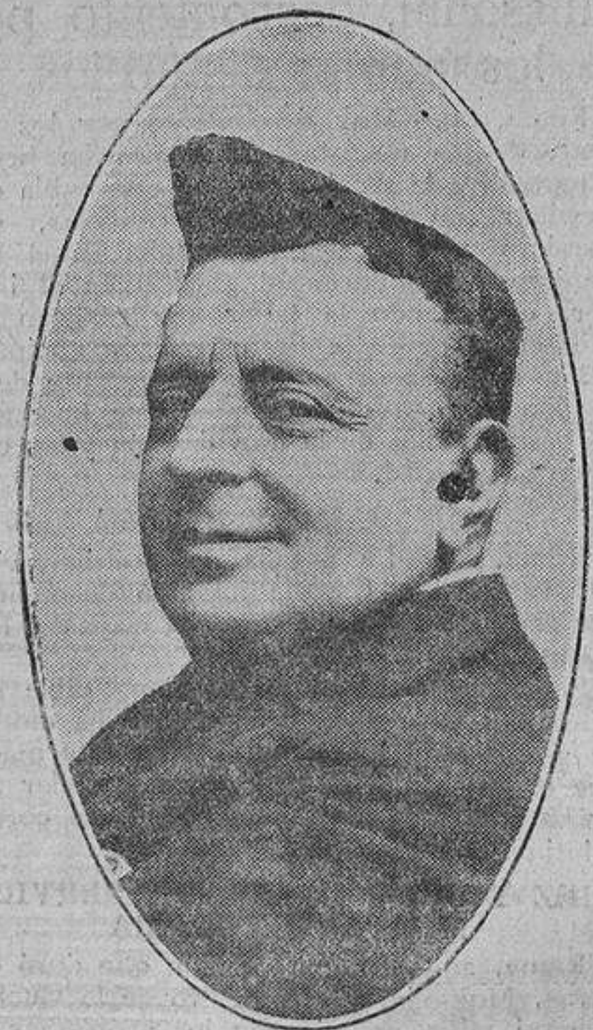
El eminent actor italiano Ermete Zacconi, que dará seis funciones en el teatro del Centro.

Nueva York, 29.—Se anuncia en los círculos bien informados que hay dispuestas para su embarque 150.000 balas de algodón. De dicha cantidad, 21.000 están destinadas a Alemania.