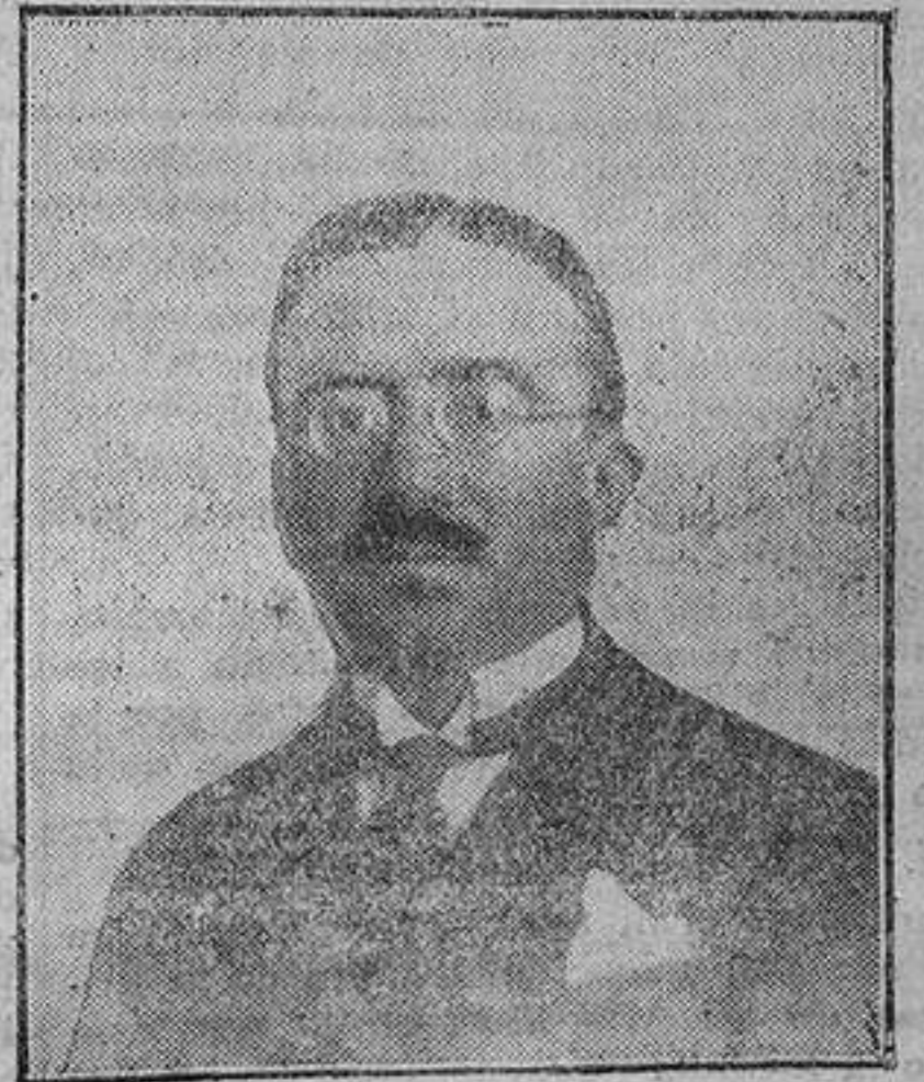
D. Alfonso Senra, subsecretario del Ministerio de Fomento.