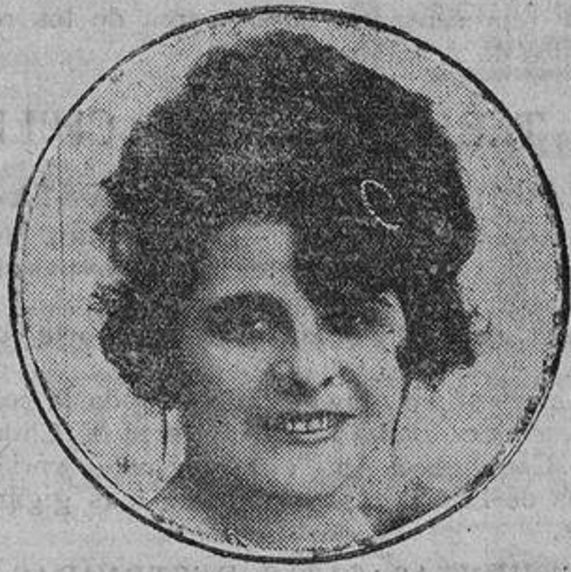
Esperanza Iris, la gentil artista que debutará en el teatro de la Zarzuela el próximo mes de diciembre.

Ahora el lector haga los comentarios que se le ocurran acerca del procedimiento y del nuevo oficio de los hombres-postes.