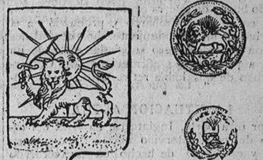
Escudo nacional y monedas persas

La rivalidad en Persia entre Rusia e Inglaterra fué en aumento hasta 1907, en que llegaron a un arreglo, por el cual se dividía a