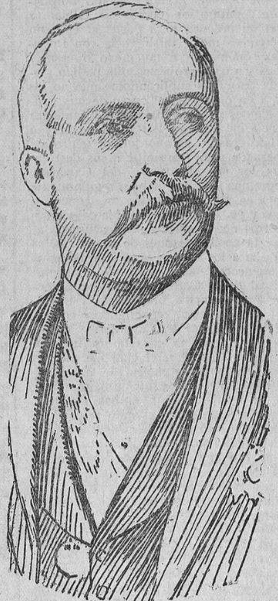
Félix Faure, sexto Presidente de la República Francesa, que realizó un viaje a Rusia, asegurando la alianza franco-rusa.

mayoría a los partidos que sostenían al Gobierno. Sus grandes cualidades, la astucia y la ciencia política y el perfecto conocimiento que de los hombres poseía el Canciller se manifestaron en todo su esplendor. El gran éxito que tuvo en esa empresa le ganaron el reconocimiento del país y el mío, y además mi total confianza. El inmenso júbilo de los berlineses por la derrota en las elecciones de los socia-