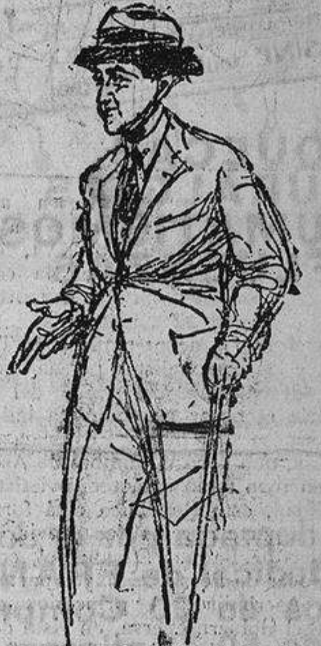
En ocasión reciente publicamos este dibujo, de Bering, que reproducia al Shah de Persia, con motivo de su estancia en Deauville. Hoy juzgamos de actualidad reproducirlo.

El Imperio persa, cuyo nombre oficial es «Mamalik, i Mahruseh i Iran» (los reinos protegidos del Irán), se divide en cierto número de provincias que cuando son extensas y contienen importantes subprovincias y distritos, llevan el nombre de mamlikats (reinos). Estos mamlikats son cinco, a saber: