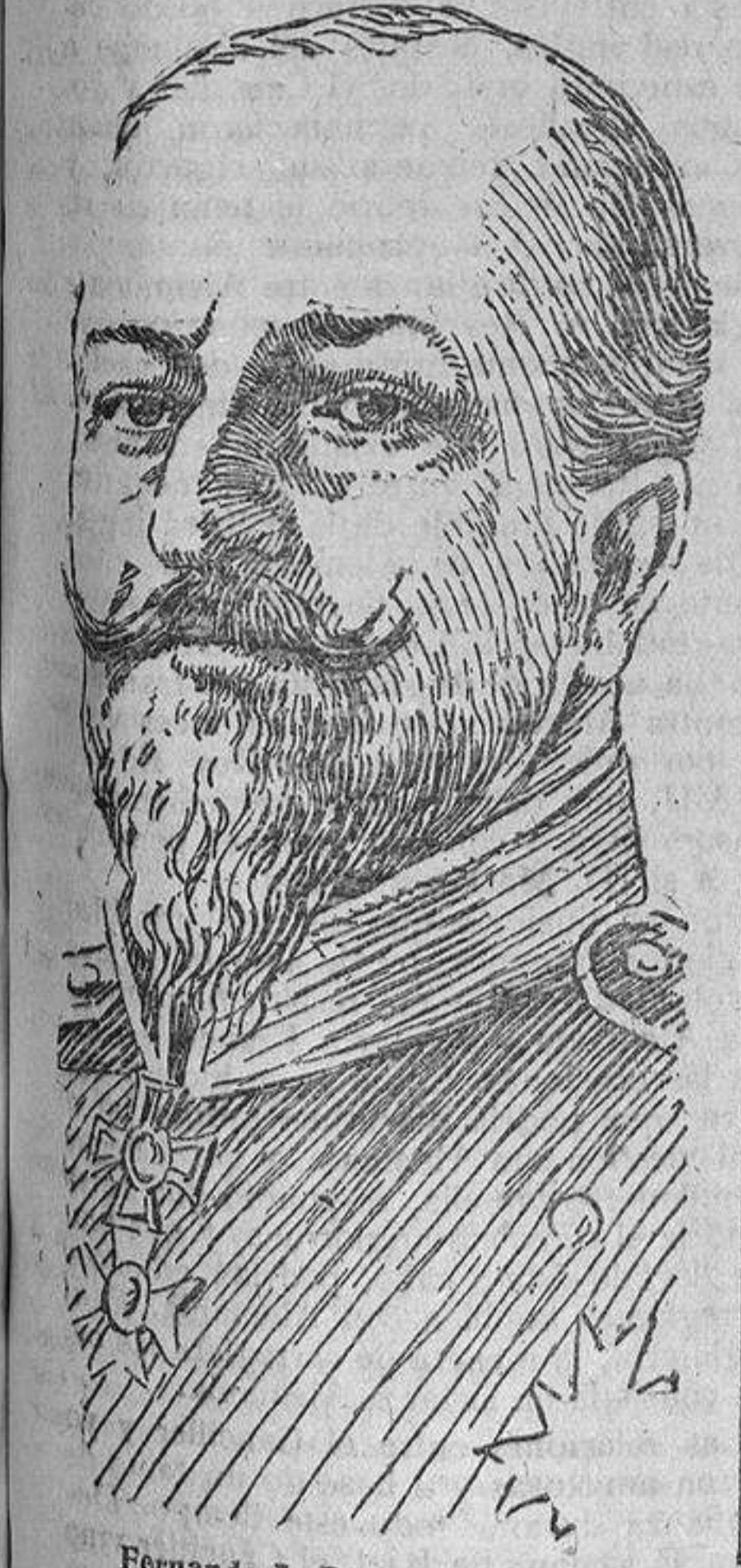
Fernando I, Rey de Bulgaria.