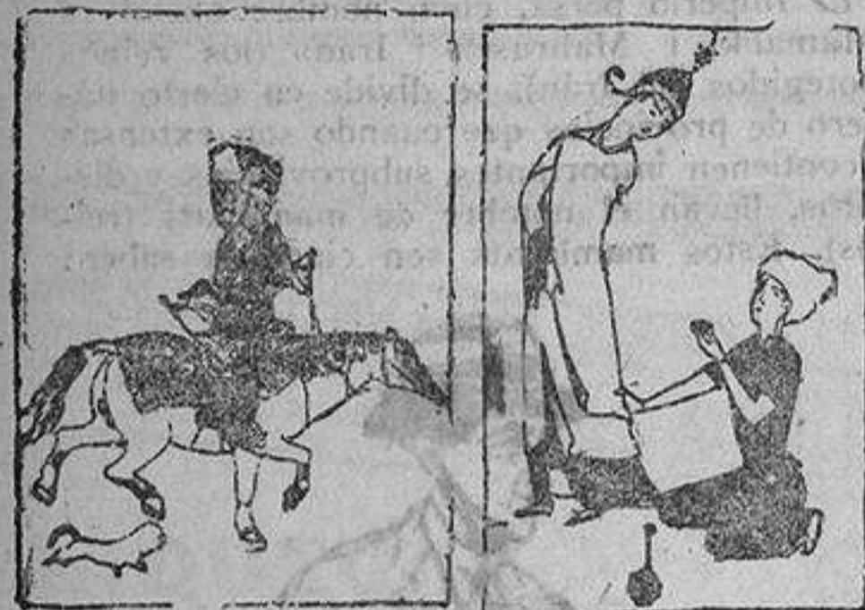
Retrat. Ernesto de Muzad. Siglo XVI.