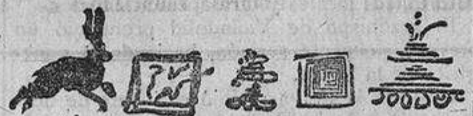
Marcas de los siglos XVI, XVII, XVIII, XVI y XIX