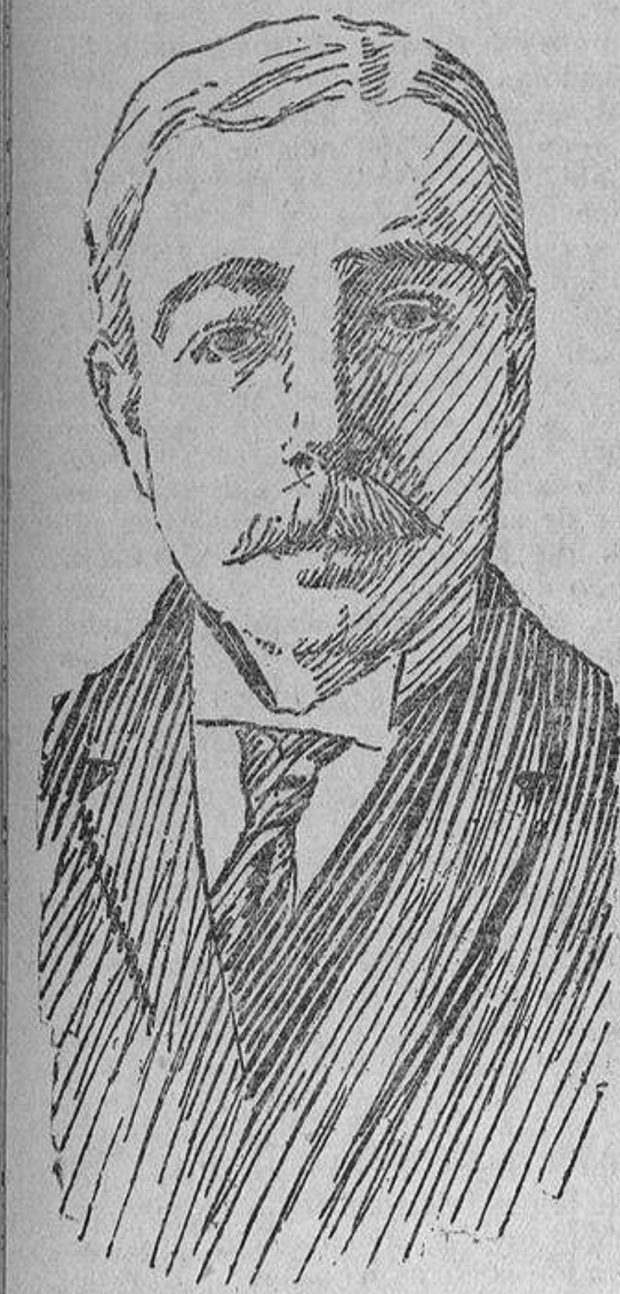
Barón von Schoen.

En fin, para nadie será cosa nueva que yo diga que no era en manera alguna cosa fácil tratar con los conservadores. Tenían mucha experiencia a causa de sus tradicionales servicios al Estado, y al mismo tiempo tenían su criterio propio, de suerte que habían llegado a poseer convicciones muy sólidas y fundamentadas y a las que se atenían fielmente como verdaderos conservadores. Era un partido que tenía en su seno grandes estadistas, ministros emi-