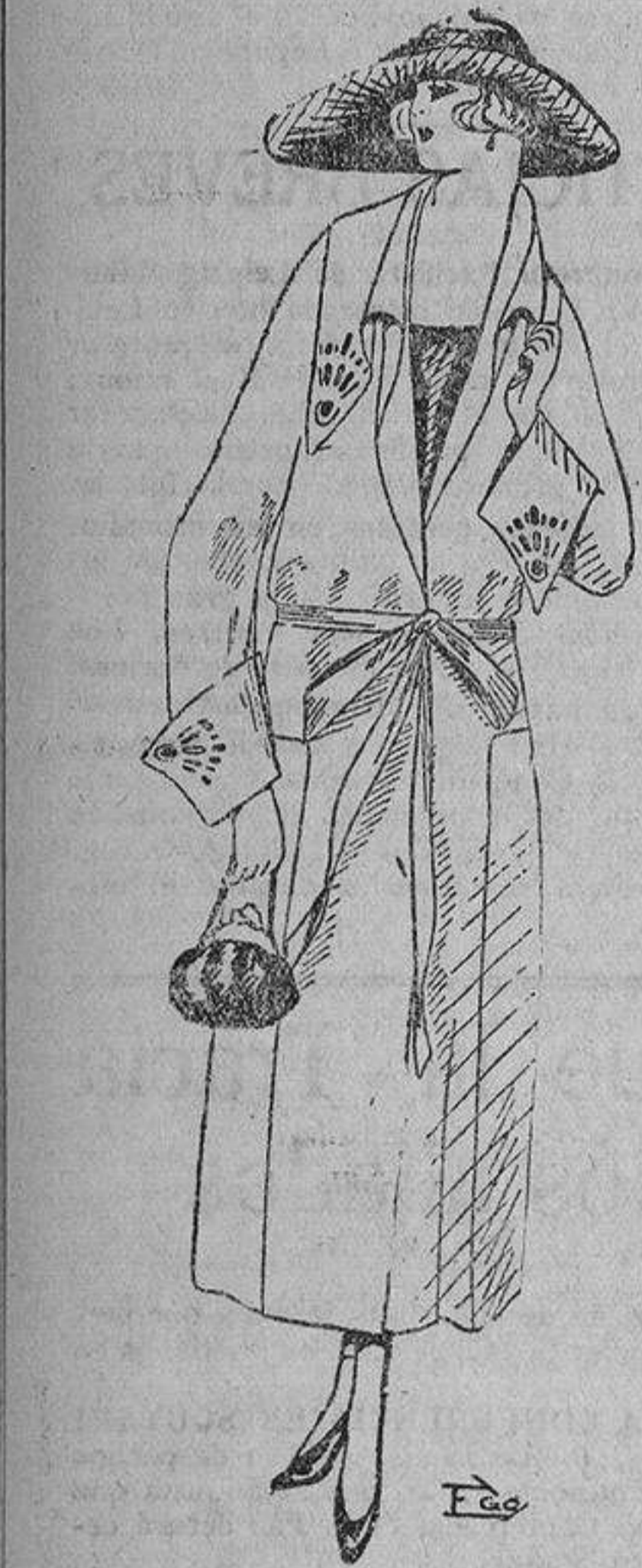
El modelo de hoy