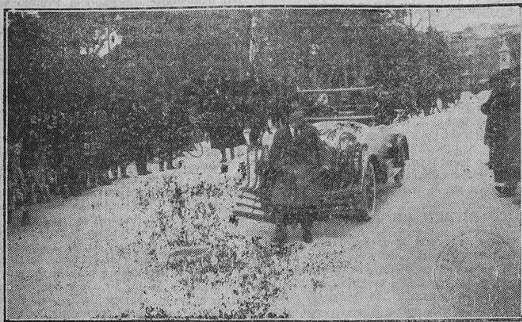
Momento interesante de un atropello de automóvil.