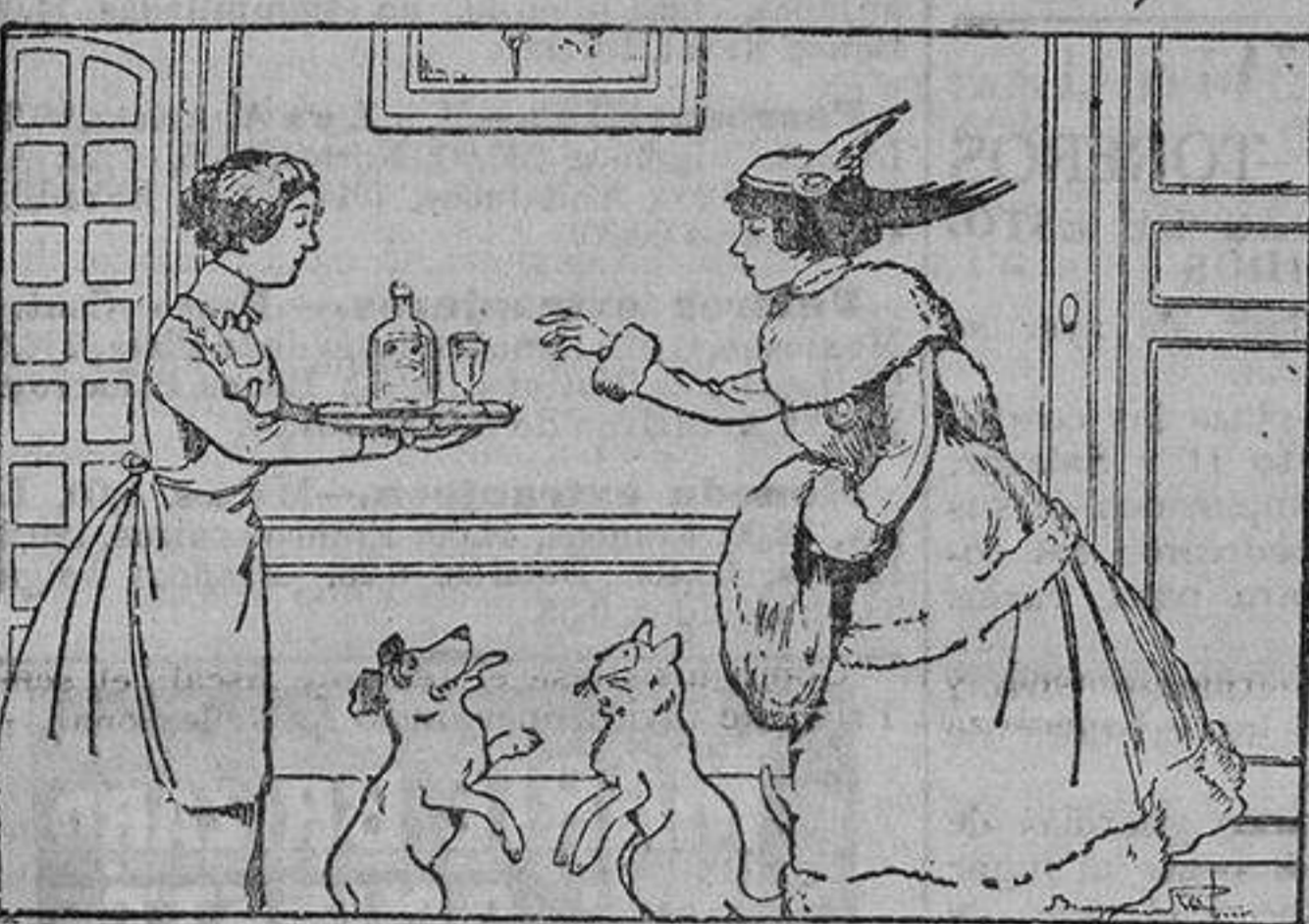
Para evitar o para curar los catarros, los bronquitis, asma, coque, gripe, tomas de Alquitran Guyot.

El empleo del Alquitran Guyot, tomado en todas las comidas a la dosis de una cucharadita de café en un vaso de agua, basta, efectivamente, para hacer desaparecer en poco tiempo el catarro más pertinaz y la bronquitis más inveterada.