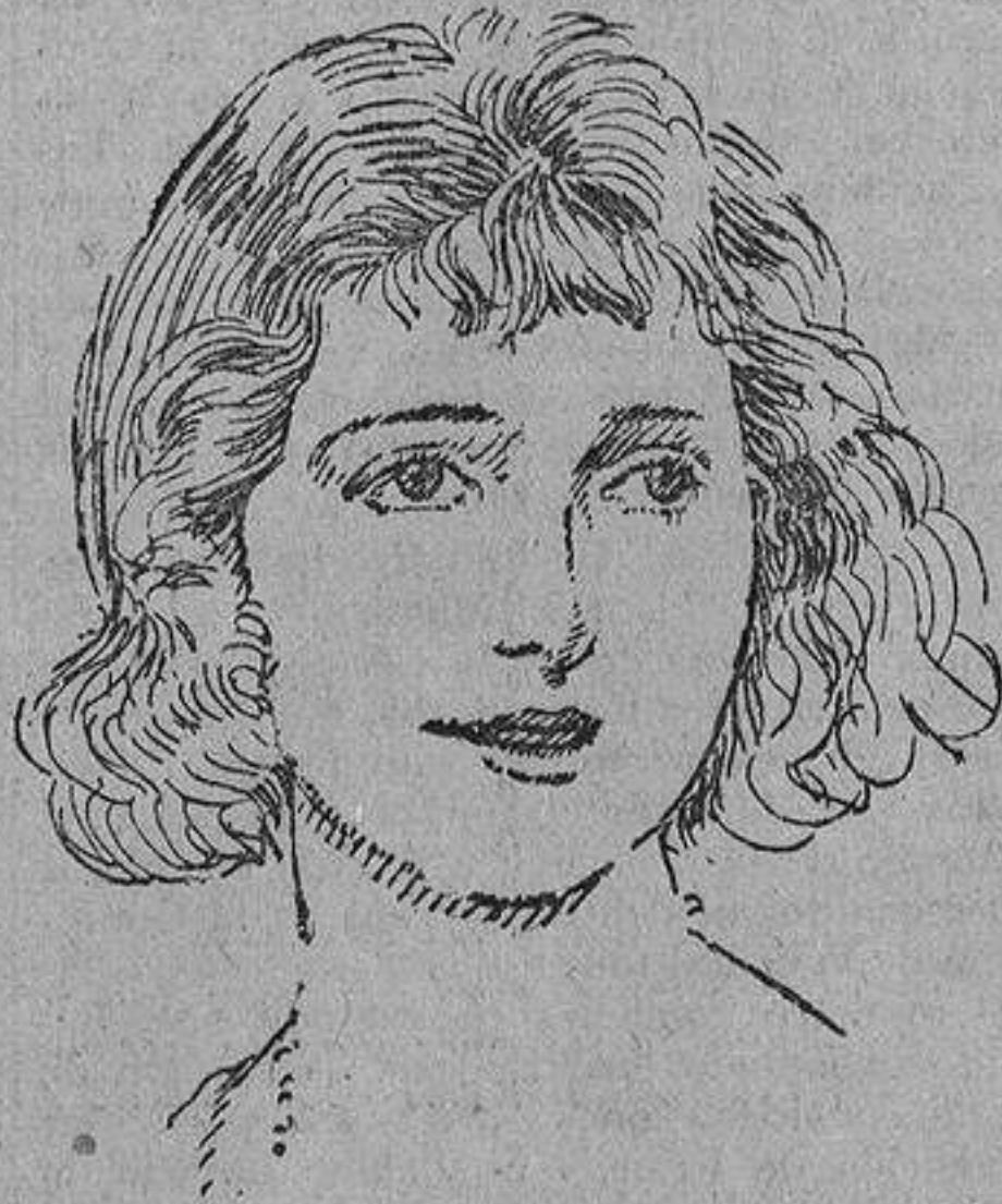
Una de las artistas más bellas y más notables de la cinematografía mundial.