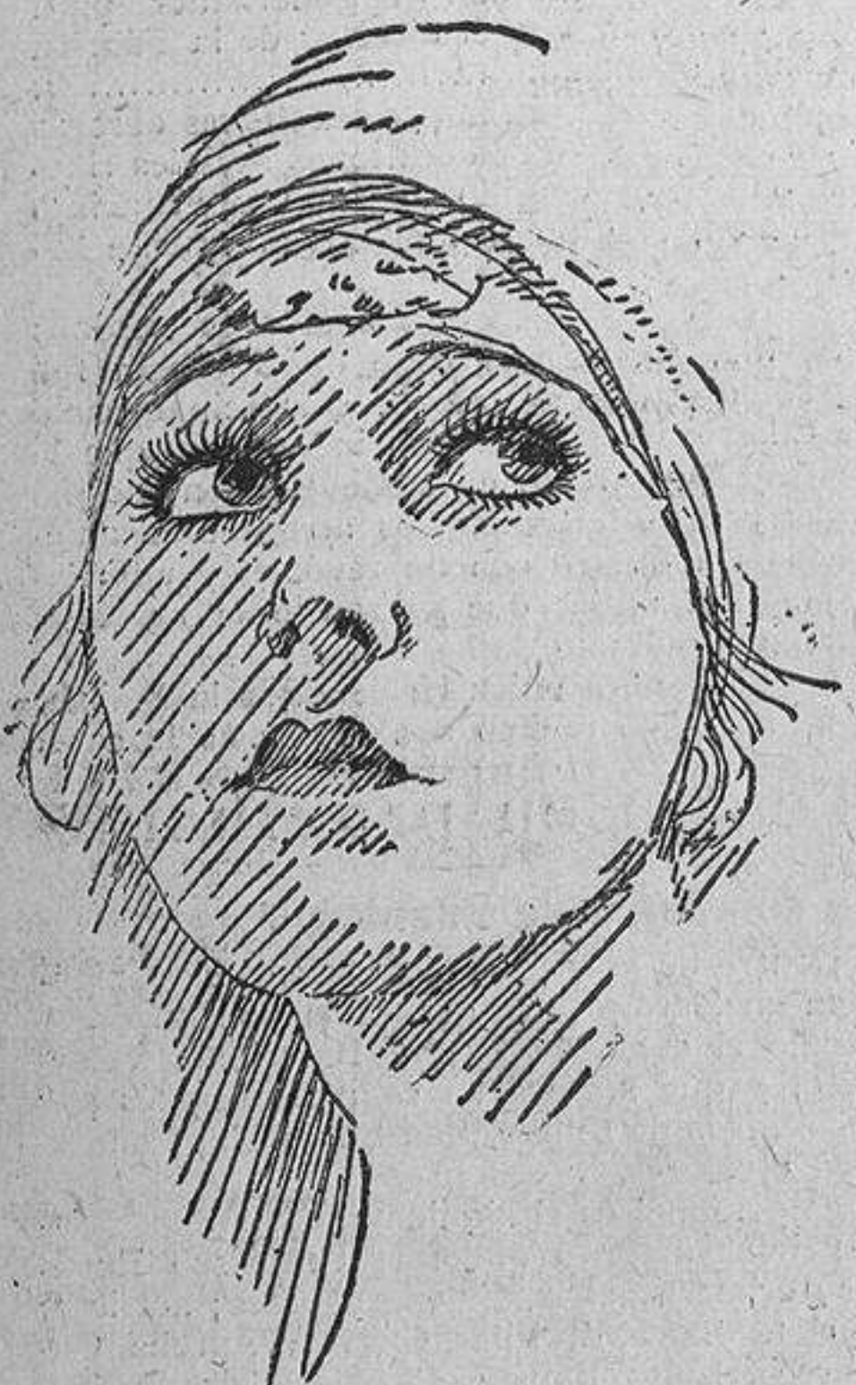
Gloria Swanson, la admirable «estrella» de la escena silenciosa, cuya belleza es excepcional

RAEL CINEMA PRINCIPE ALFONSO Grandes programas