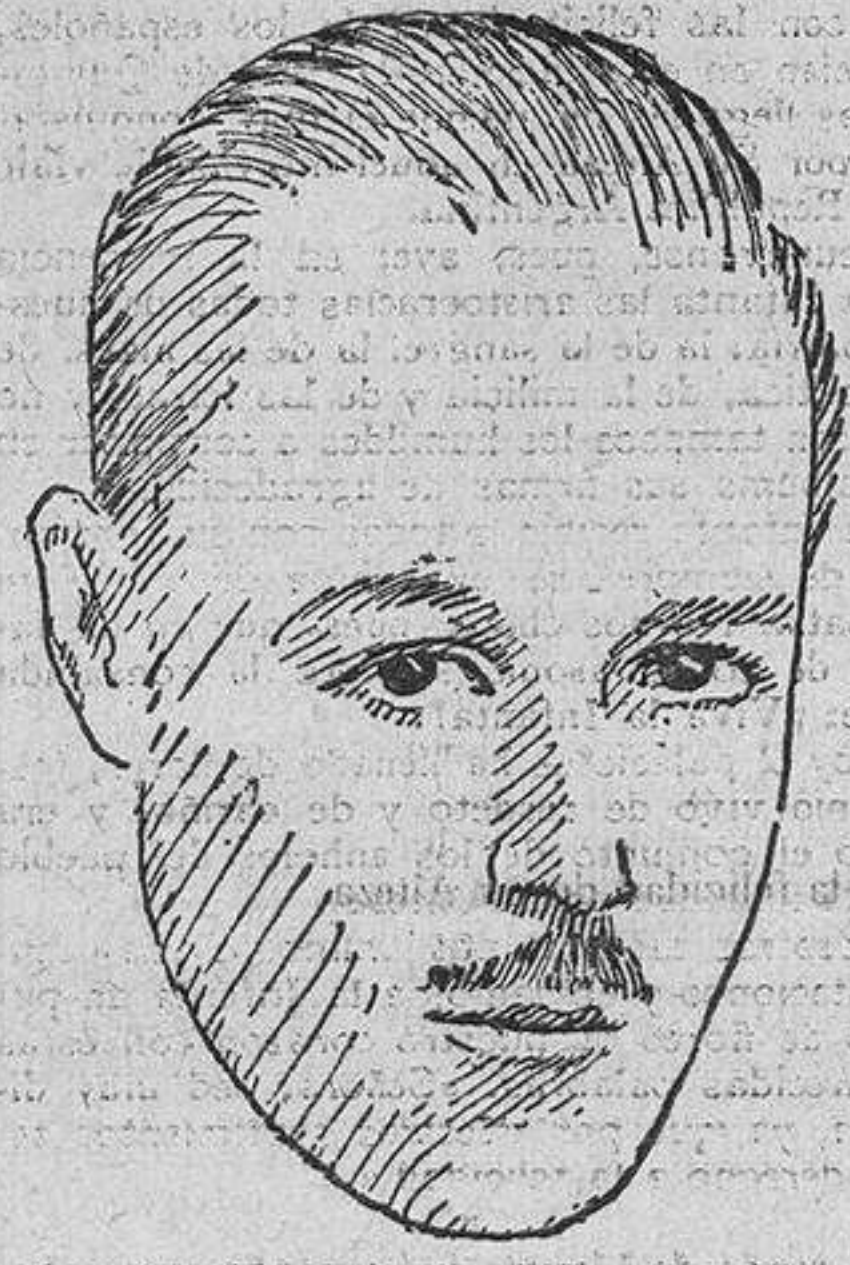
Jack Holt, uno de los artistas más jóvenes y más notables del «film»