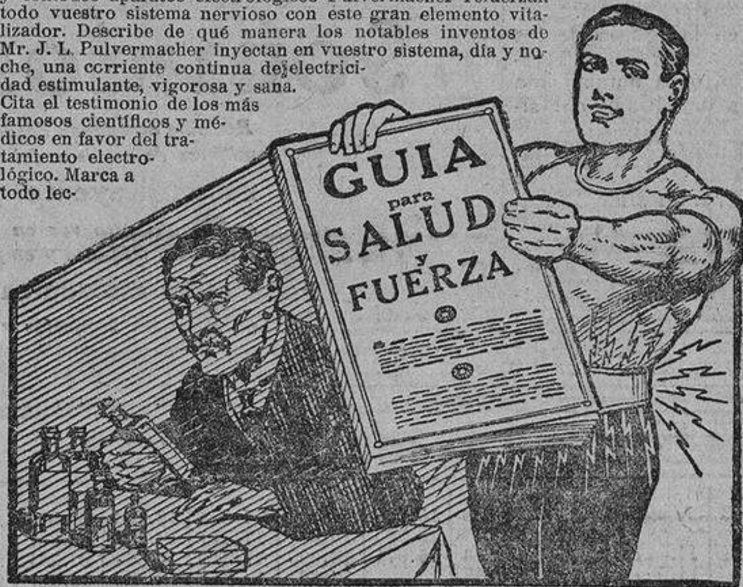
Este libro se envía gratis, sin costo ni obligación. Os convencerá de que los medicamentos no tienen poder curativo en sí mismos para fortalecer un sistema debilitado, y que la electricidad, por otro lado, proporciona al cuerpo enfermo la electricidad natural de que carece.