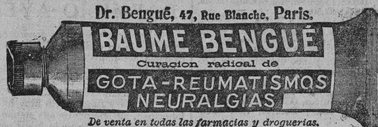
Dr. Bengué, 47, Rue Blanche, Paris. De venta en todas las farmacias y droguerías.

¡Españoles! ¡Extranjeros! Venid al "Tercio de Extranjeros" que defiende el honor y territorio nacionales. Se abre un enganche por la duración de la campaña. PREMIO 300 pesetas. Sigue abierto el enganche por cuatro y cinco años, con 500 y 700 pesetas de premio, respectivamente. En el Gobierno Militar podéis inscribiros. No se exige documentación alguna. El Tercio Extranjero es un cuerpo ya glorioso.