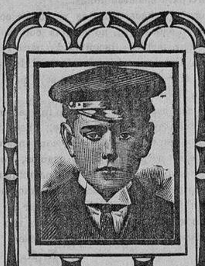
Barcelona, 11 Abril 1908. CALLE CONDÉ ALALTO NO. 42.