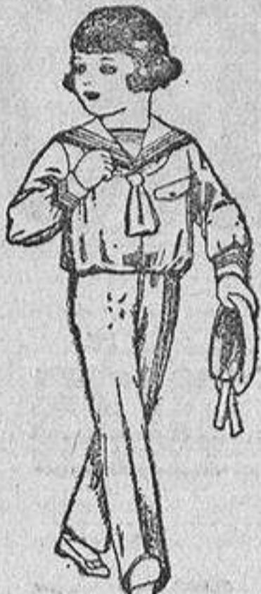
Trajes modelo "Marinera" de dril otomán blanco, para niños de tres a nueve años. De ptas. 16 a 28.