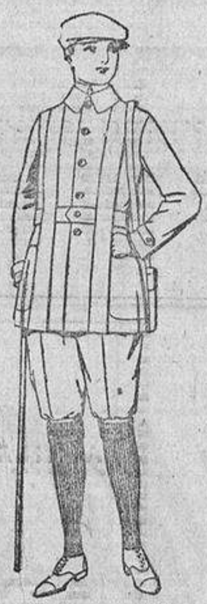
Cazadoras de dril crudo o kaki. De ptas. 20 a 28. Pantalones cortos de dril beige o gris, para excursionistas. De ptas. 11 a 22.