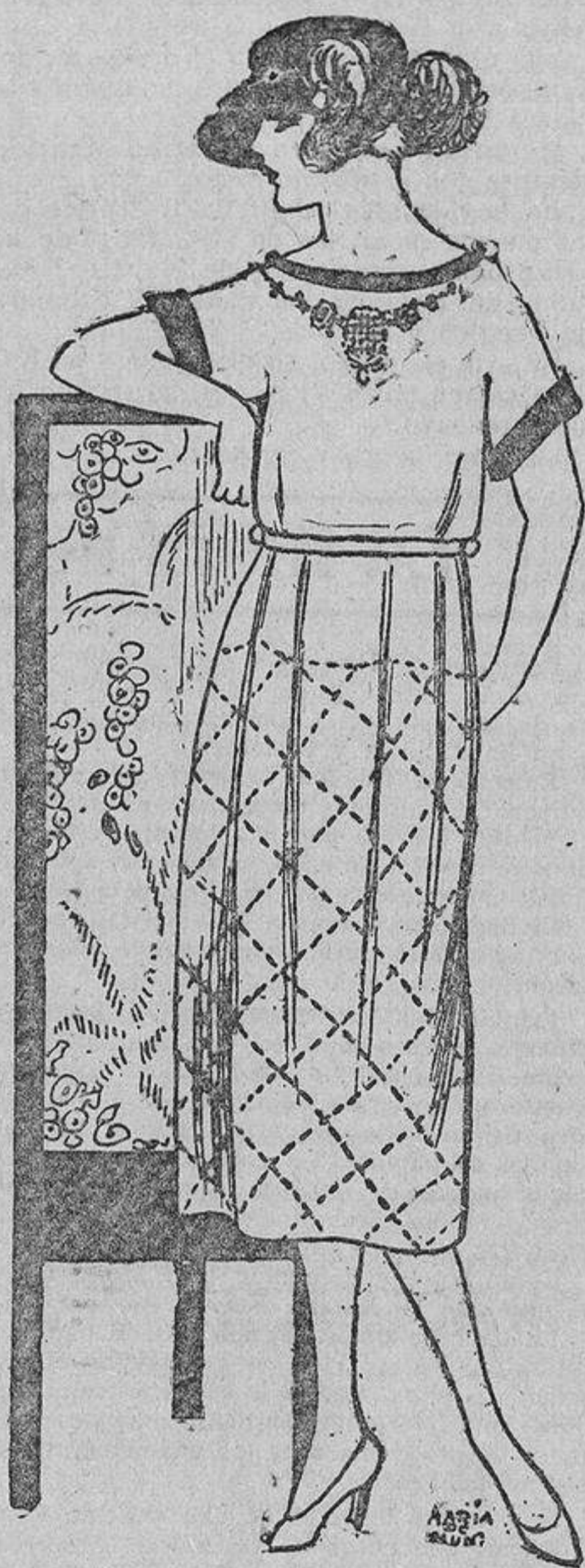
Sencillo, cual conviene a una joven bonita, de tela de hilo blanca adornada con cadenas y tela color canario.