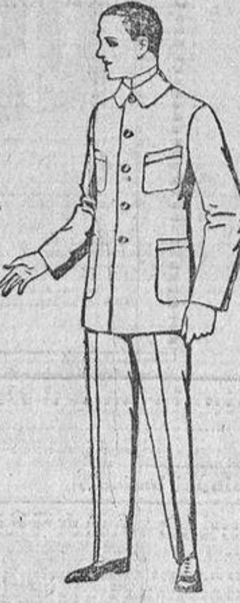
Trajes de dril, azul, para mecánicos. De ptas. 20 a 31.