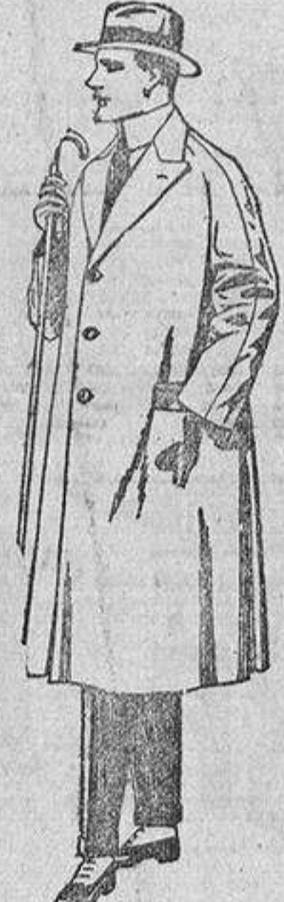
Gabanes de melton, gabardina, etcétera. De ptas. 70 a 150. Los mismos, a medida. De ptas. 85 a 220.