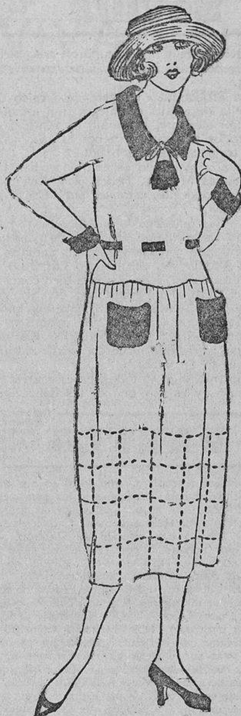
De un tejido de algodón crudo, tiene unas cadenas marcando un cuadrículado y unos bolsillos, puños, cuello, etc., del color de sus labios.

gusto suplir la riqueza con la originalidad. Así, por ejemplo, vemos lindos mantelillos con incrustaciones o bordados originales en colores atrevidos suplir elegantemente manteles con encajes verdaderos de un coste cincuenta veces mayor que el de ellos.