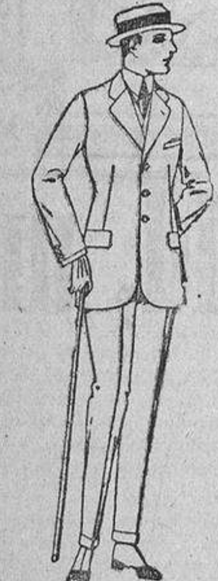
Trajes de lanilla, melton, estambre, etcétera. De ptas. 38 a 120.

Barcelona, Alicante, Almería, Bilbao, Cádiz, Cartagena, Gijón, Granada, Málaga, Palma de Mallorca, Santander, Sevilla, Valladolid, Valencia, Zaragoza