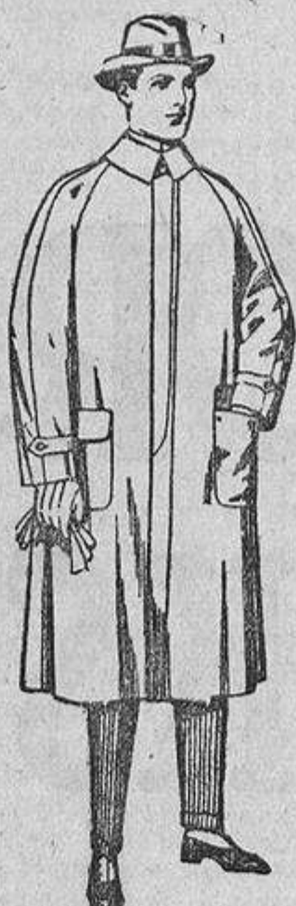
Impermeable forros gabardina, etcétera. De ptas. 65 a 155.