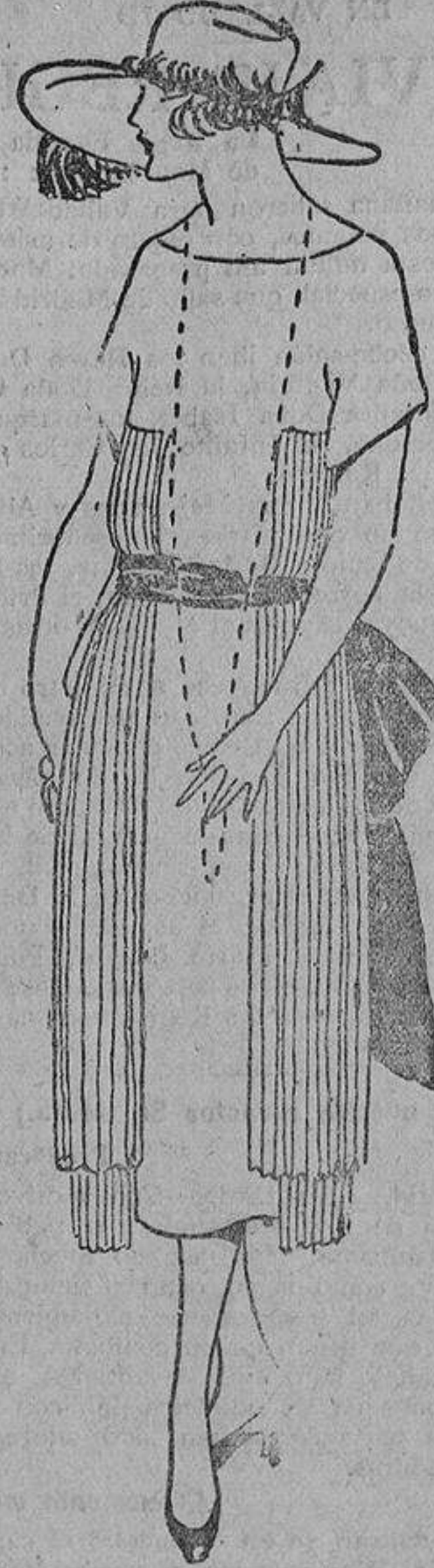
Vestido de «fusor» fresa, liso y plisado.