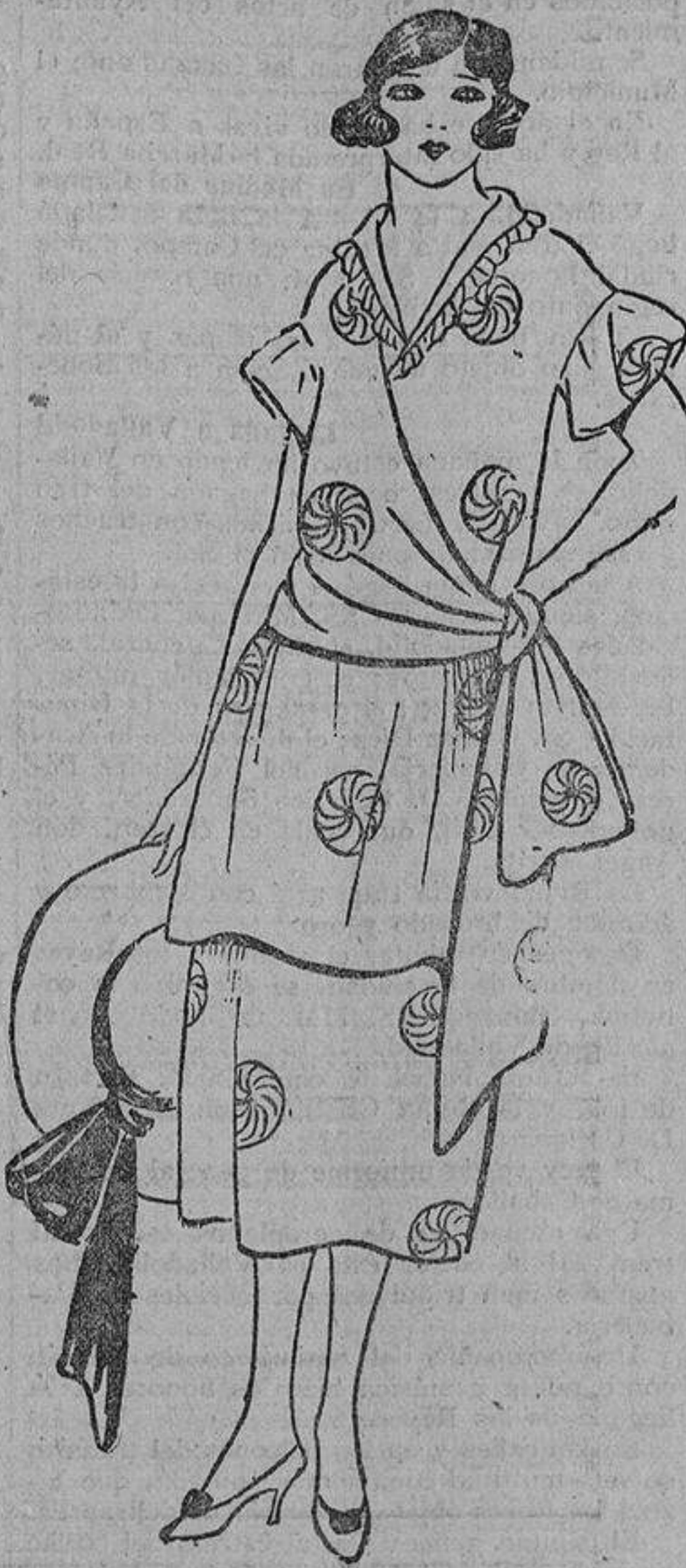
«Foulard» azul marino con motivos blancos. En la falda dos volantes de poco vuelo.