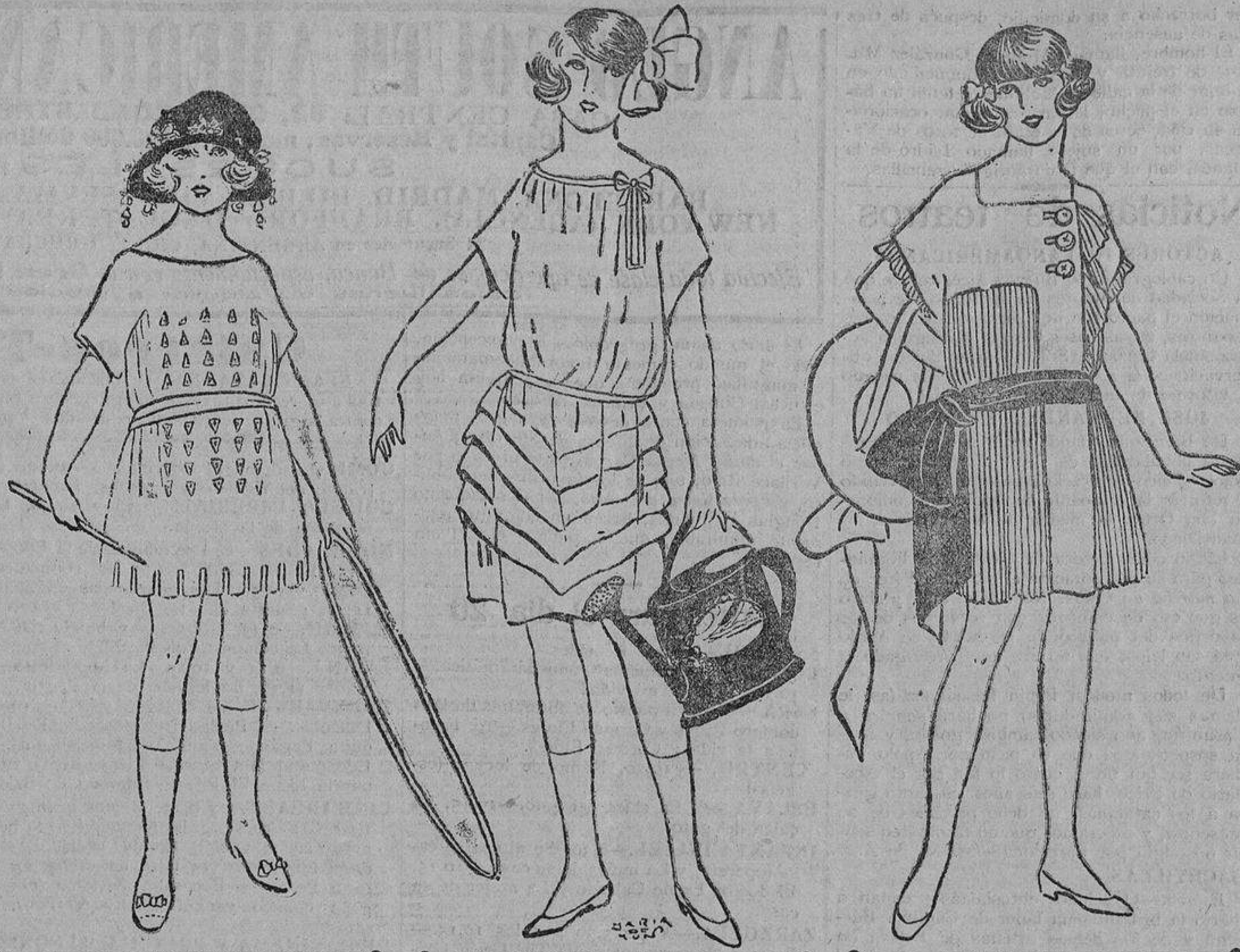
Original este modelito de crespón de seda café con leche (claro), el borde recortado y triángulos sobrepuestos de paño sujetos por perllitas.