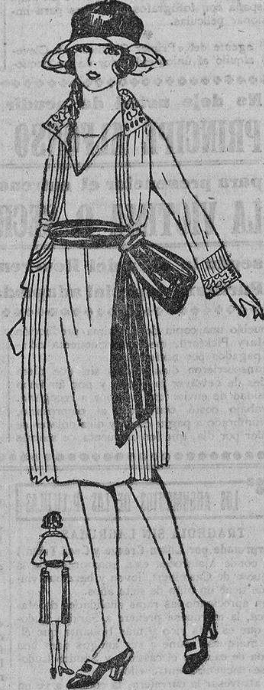
Sospechaba que era esbelta y gentil, pero desde que lleva este vestido de lana blanca, con bordados y banda azules, ya no duda, está segura de ello porque todo el mundo se lo dice.

y la mejor prueba de la necesidad que de ella existía, y del ansia con que ha sido recibida, es ver cómo se agotan rápidamente las ediciones, no solamente en España, sino en el Extranjero, donde ha tenido una extraordinaria acogida.