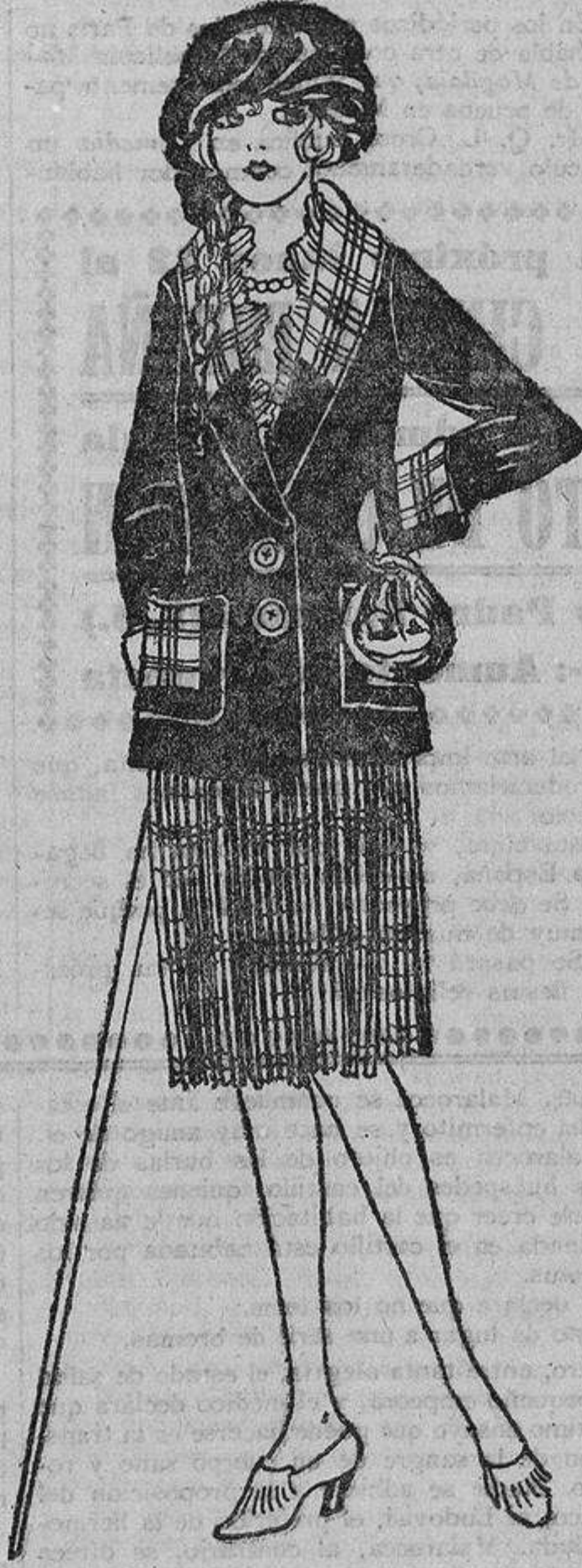
Anita, aunque apenas cuenta quince años, tiene su gusto personal y adora la sencillez; por eso lleva para calé una chaqueta azul marino oscura, de corte sastre, adornada con un tejido escocés, de cuyo tejido es la falda plegadita.