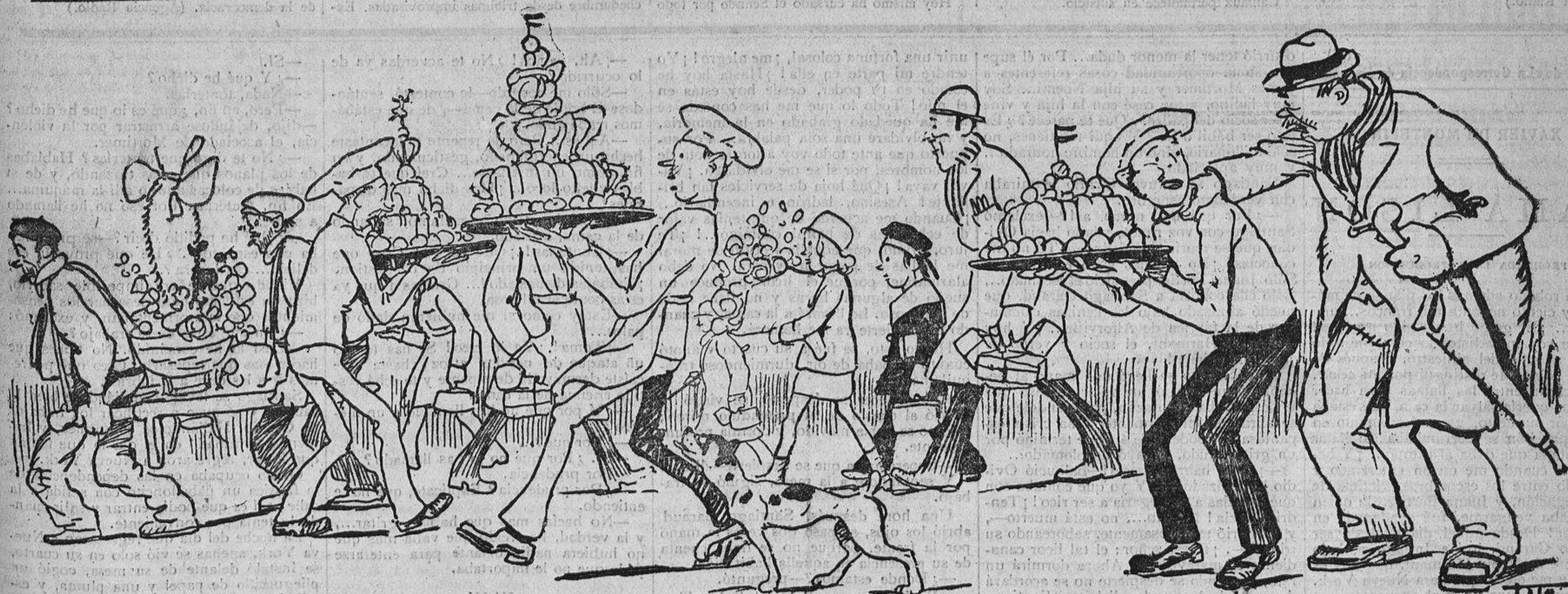
El marmítón, con la boca llena: ¡Yo también me llamo Pepe!