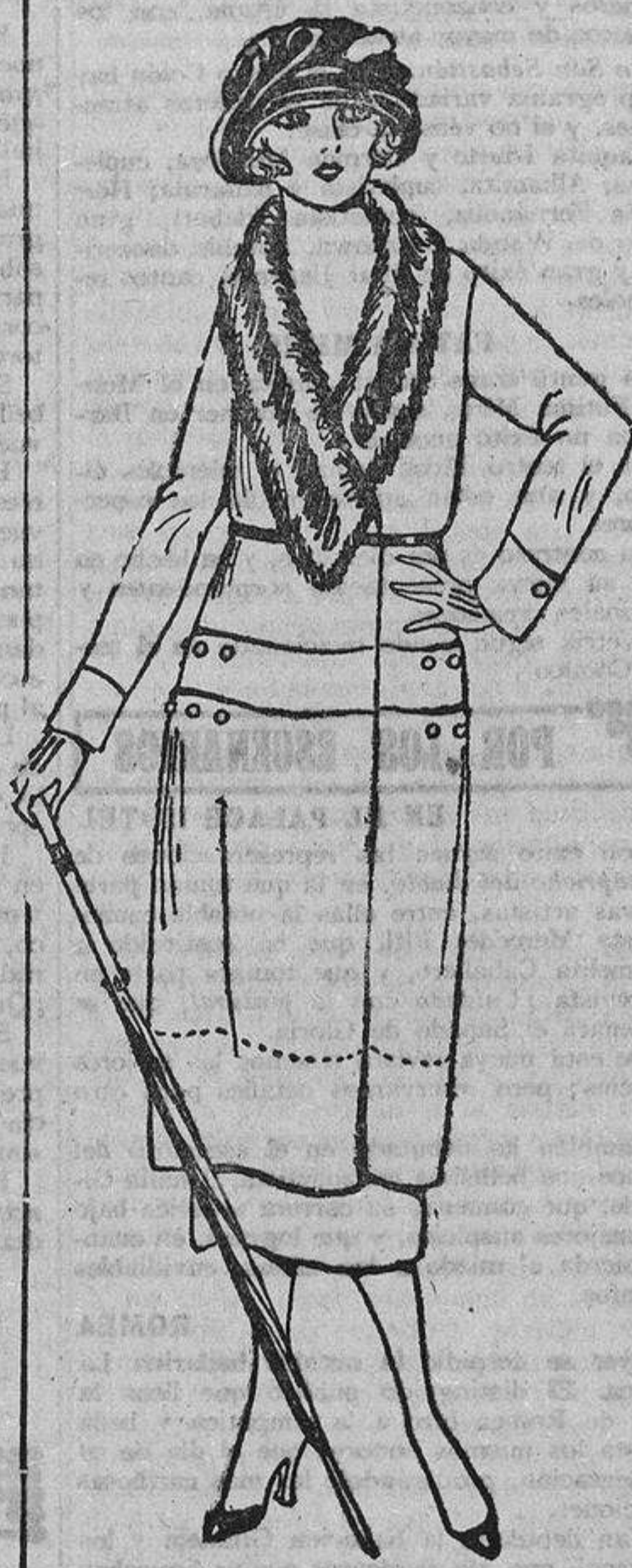
Los chaquetones largos tienen gran aceptación; este modelo, de paño tabaco, está cortado a los lados para formar una imitación de bolsillos, con cuero interior; los botones y el cinturón son asturismo de cuero.

tualmente empleada para teñir de rubio el cabello con poco gasto; para operar con más rapidez y perfección se mezcla el agua oxigenada con amoníaco. Pero tiene el inconveniente que el rubio así obtenido es característico e inconfundible con el rubio natural, razón que debe bastar para que no recurran a este vulgar procedimiento las mujeres que quieran pasar por rubias naturales.