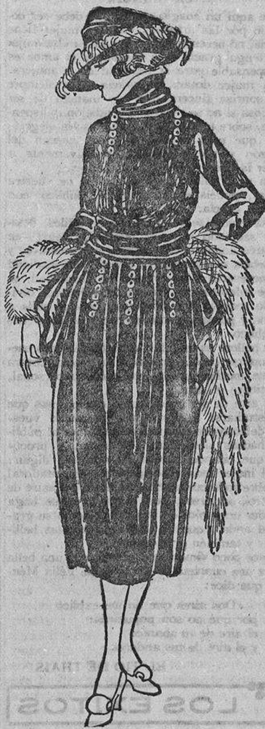
La combinación del blanco y negro es siempre elegante; por eso no puede menos de gustar este vestido de «charmeuse» negro, adornado con botones de nácar y «vuelitas» de «charmeuse» blanca en el cuello y «caídas» de los lados.