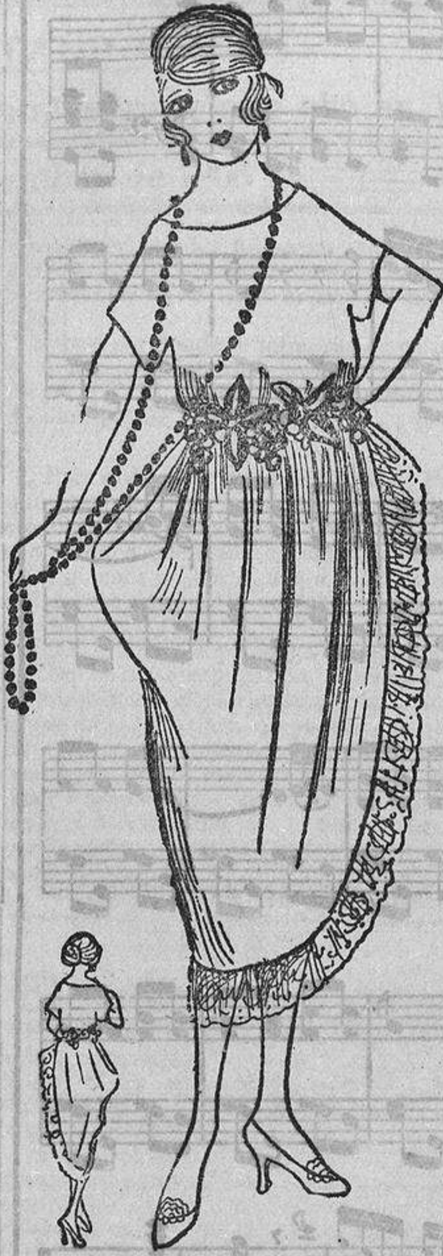
Si un vestido de baile puede ser «juven» será recordador de ese adjetivo este traje para baile, de raso flexible blanco, drapado a un lado y con una guirnalda de flores y uvvas rodeando el talle.

«Piel de matiz cálido.» Algunas morenas con cutis de rubia, que parecen más coloreadas por el contraste del cabello negro, procurarán empalidecerse con colores neutros: tabaco español, hoja seca, té, gris perla. Pueden elegir el coral velado por gris, el gris topo velado de rosa y todos los colores francos velados por oscuros.