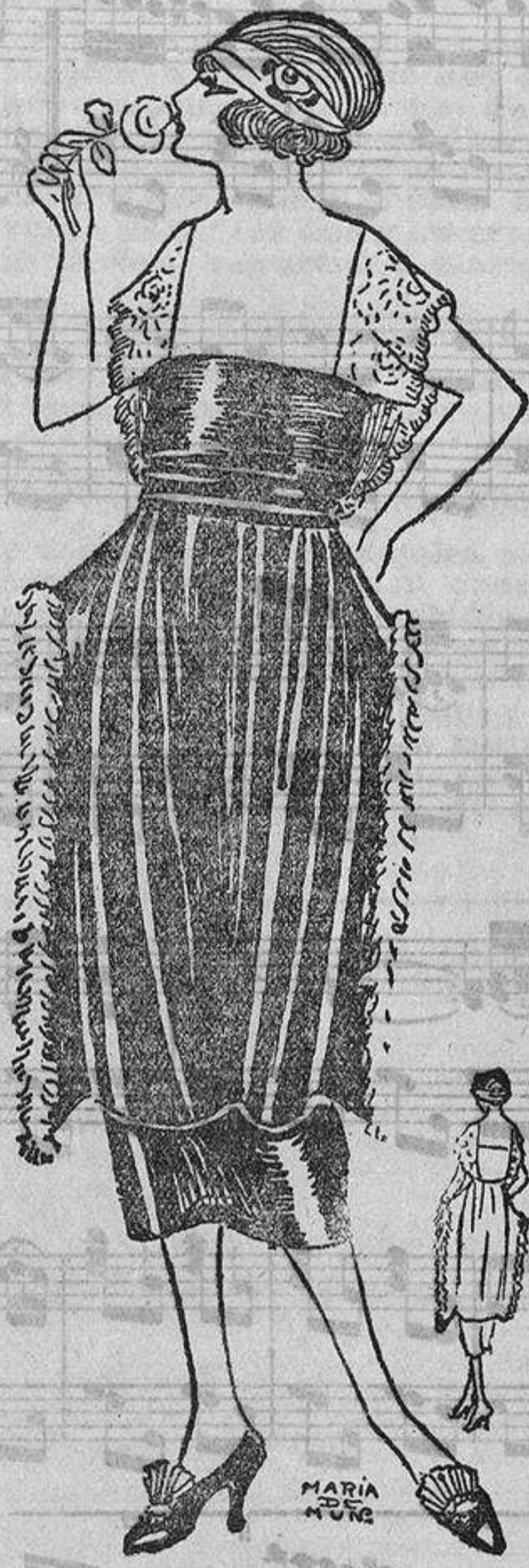
¡Que linda manera de aplicar la mongolia blanca en estrechas tiras a los lados, como si fuese un fleco de pluma! El vestido es de crespón de china rubí y el encaje tiene unos hilos de plata.