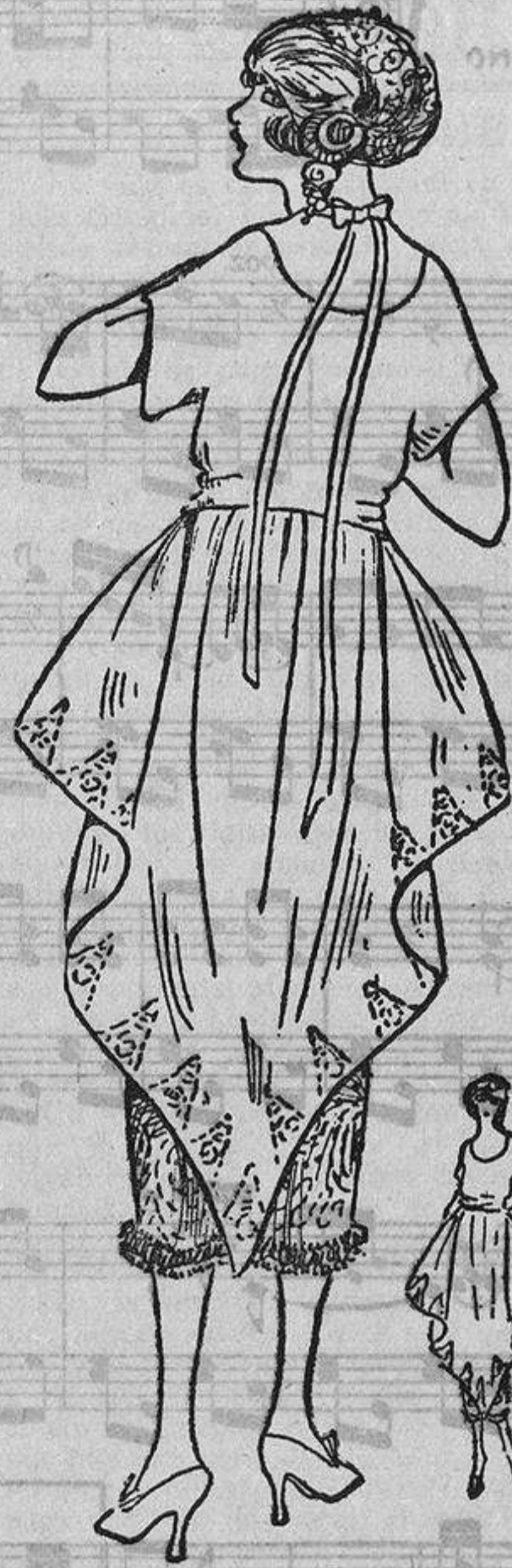
Quizá el éxito de este vestido estriba en el lactio «sigueme pollo» que lleva en la nuca; de tafetán rosa es el modelo y los bordados están hechos con cuentas de cristal e hilillo de plata.

«Piel radiante.» Una carnación perfecta puede adoptar todas las osadías. Las rubias un poco rojizas, las morenas con reflejos caoba, las rojizas, todas las que poseen el don maravilloso de una espléndida carnación, a las que todo sienta bien, no necesitan consejos; pueden elegir en toda la gama de colores, sin temor a que desmerezcan sus encantos.