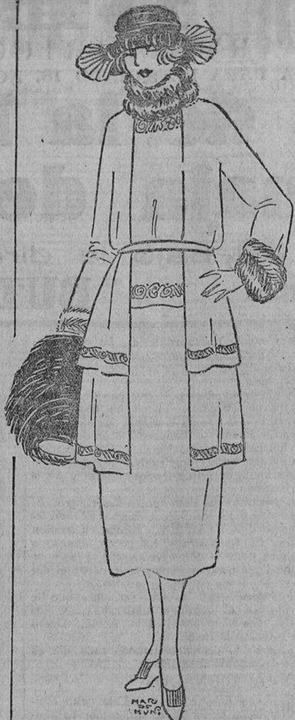
La chaqueta, con dos volantes lisos, está bordada con hilo de cobre; el chaleco, de paño color ladrillo, tiene los mismos bordados. El vestido, marrón.