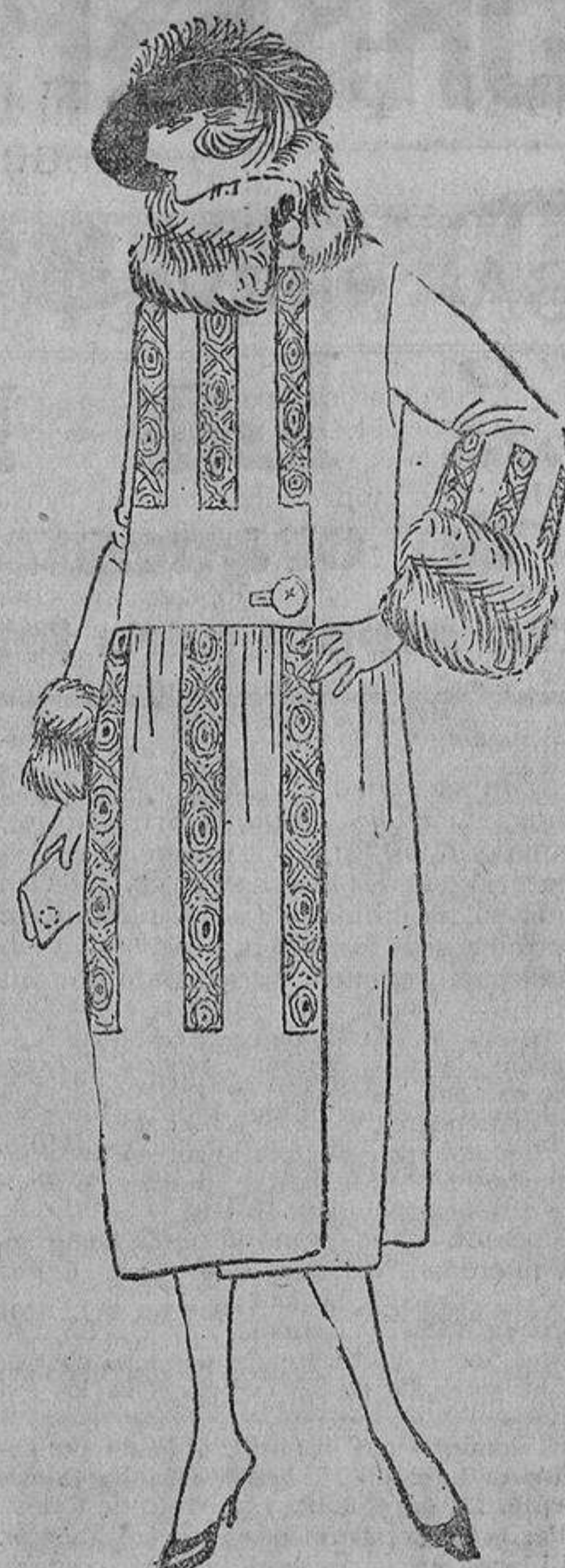
Para que haga discreto, los bordados son tono sobre tono; el canesú se apoya en las caderas formando talle bajo.

Se ven muchas tocas de plumas pegadas; son de un solo color, y a un lado cae como borla una pluma desrizada, junto al rostro. Es un modelo muy favorecedor, y destinado para los bailes de tarde y teatros.