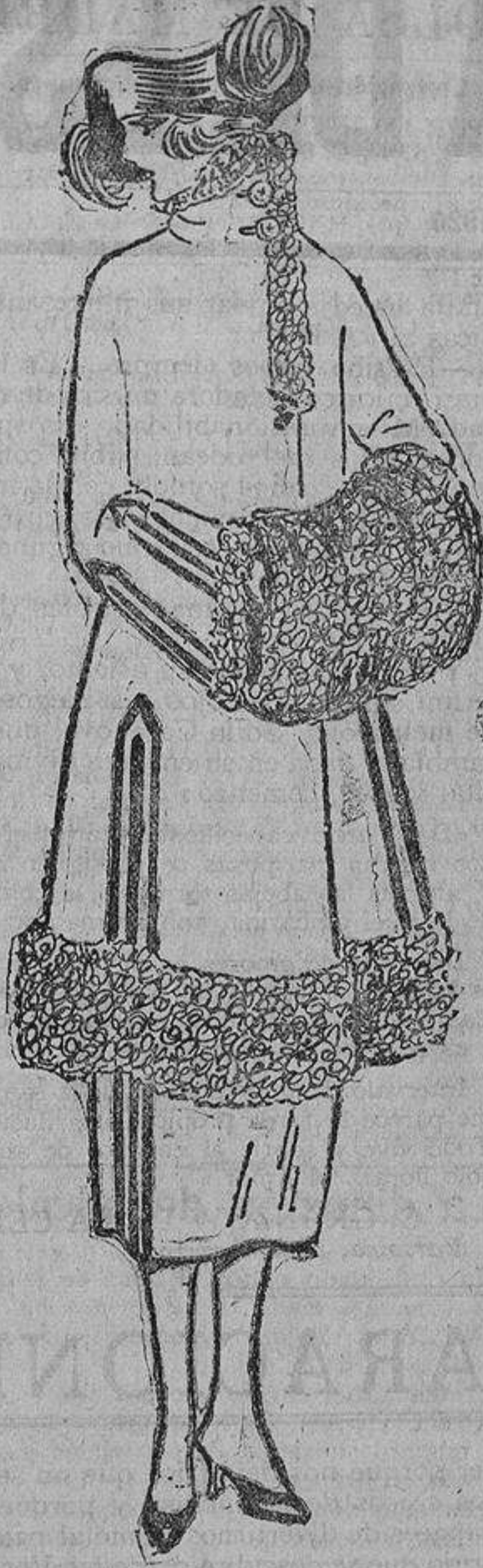
Todo gris, incluso la piel de cordero, que está teñida en dicho tono. Galones de plata oxidada.

Como la mayoría de las mujeres tenemos ya las orejas «bárbaramente mutiladas», de ahí que sigan viviendo los pendientes, estando además como estamos convencidas de que son el adorno que más favorece al rostro. Favorecen sobre todo por hallarse tan cerca de él y ser las únicas joyas colocadas al nivel de la sonrisa, ya que todavía no hemos adoptado el pendiente en la nariz, como las salvajes, y como quiso lanzarlo la pintoresca y original artista francesa Mlle. Polaire.