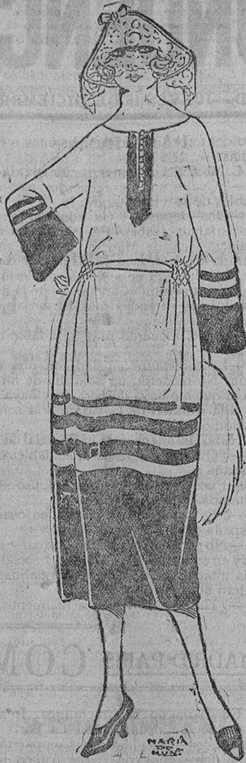
Este modelo de París está hecho combinando dos tejidos del mismo tono, (color cuero) uno de ellos; el de la parte superior es de lana mezclada con seda, y el bajo de gruesa lana peluda.