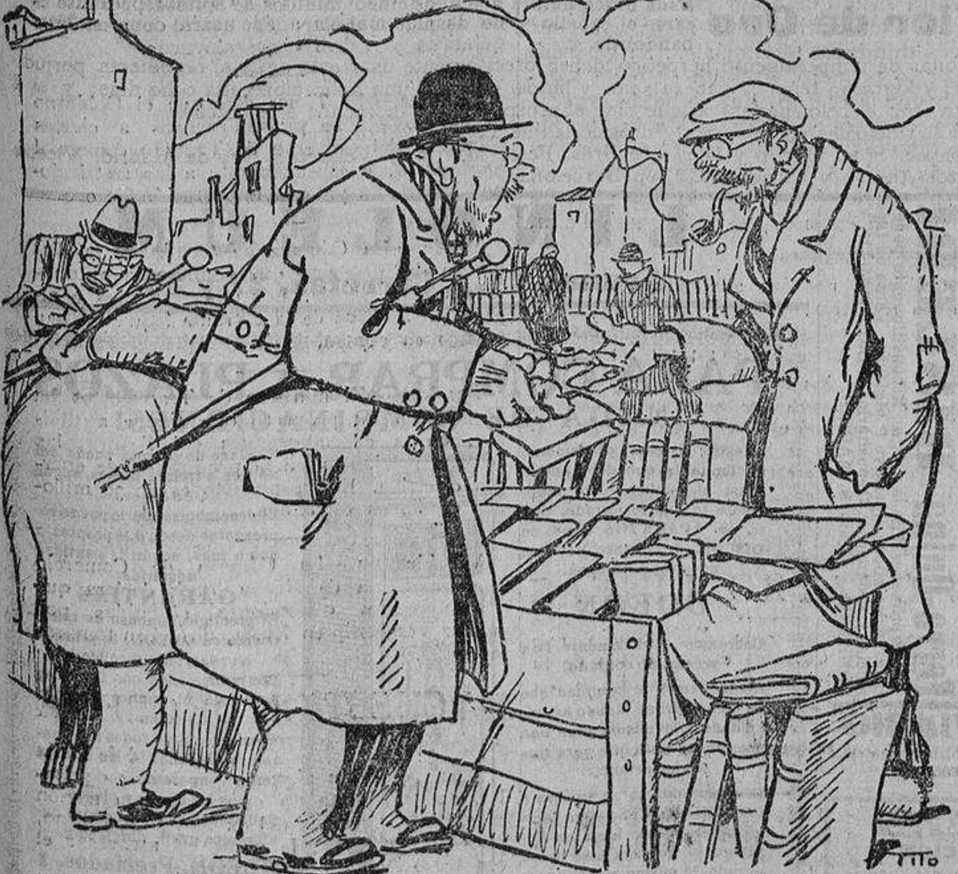
—Pero, hombre... ¡Seis pesetas esta edición antigua de Esproncedal! —Tenga usted en cuenta lo mucho que ha subido el papel!