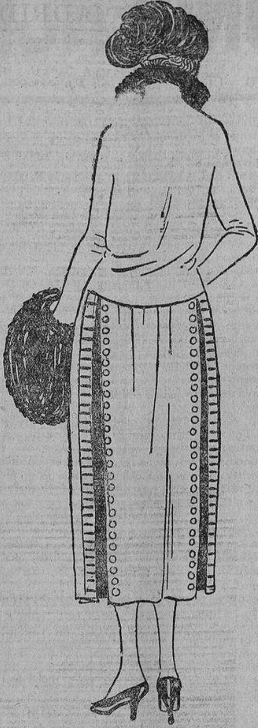
Sobre una falda interior de raso negro, un vestido de fina sarga azul marino con dos aberturas delante y detrás, que dejan ver el bajo con botones y ojales.