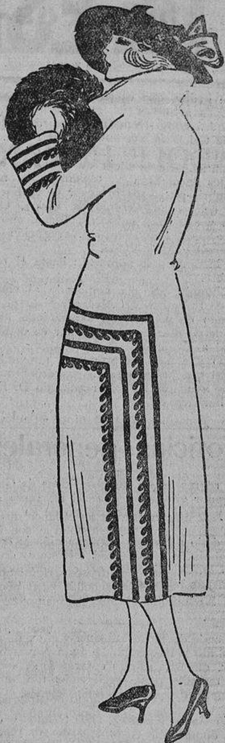
Un detalle muy «chic» y de gran modelo consiste en unas tiras de paño, unas lisas y otras en forma de greca, cortadas e incrustadas sobre una tela de distinto color.

Hay que renovar constantemente el repertorio de los salmos y aleluyas. La Moda es bella, la Moda es grande, la Moda es eterna (desgraciadamente). Llegada la primavera, empieza el cántico primero; ya se sabe, hay que decir que nunca la moda ha sido tan bonita como aquella primavera; que las mujeres, al abandonar