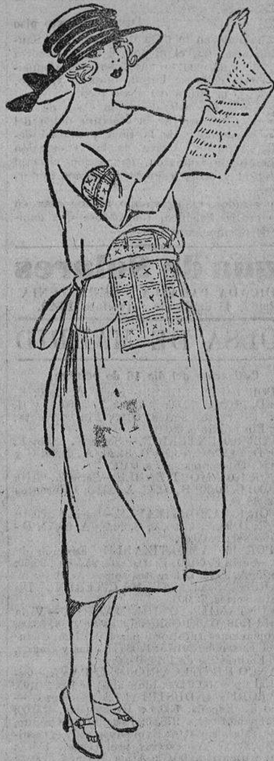
Muy sencillo, pero puede resultar un «número» interesante en el guardarropa de una joven; es de gabardina marino, con bordados granate y oro.

Se adornan mucho con cintas; un artista fabricante ha lanzado una gran variedad de dibujos y clases de cinta, verdaderas maravillas, que fácilmente combinan a cualquier sombrero un sello «chico» y un aire de modelo. Los hay con dibujos chicos de colores maravillosos, con dijes y pagodas misteriosas; con pájaros, gacipios, tonitos, flores, etc.... Todo ello maravillosamente trabajado con sedas, hilos de oro y plata, que se mezclan armoniosamente en un detalle de riqueza y colorido de un gusto muy seguro y depurado. También se em-