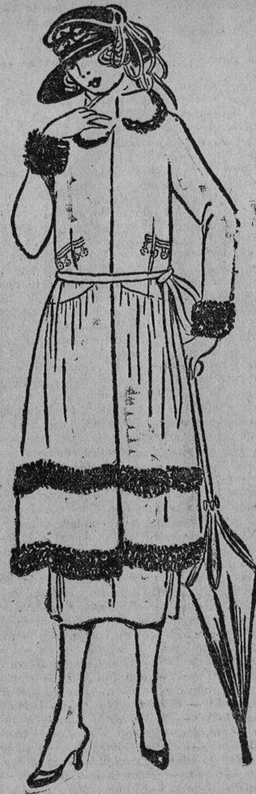
Muy dentro de la nota del día, este modelo de punto de lana marino adornado con piel de topo; franco debajo del talle, todo alrededor.

plea la cinta encerada, muy brillante, que se presta a efectos más sencillos y elegantes.