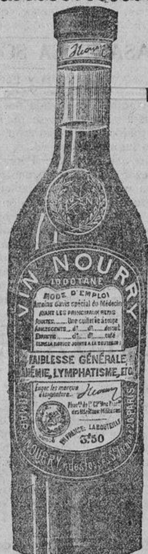
Se vende en toda Farmacia acreditada.

25 PESETAS diarias de ganancia, personas ambos sexos, edad y condición, sin capital. Trabajo en familia.—Unión Internacional, REY FRANCISCO, 4, MADRID