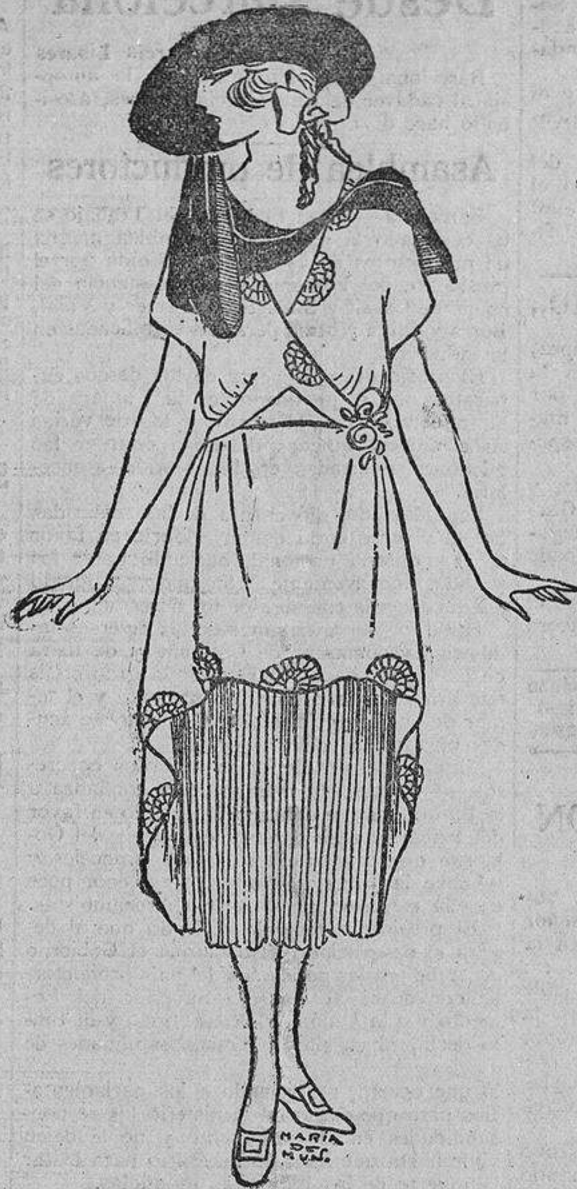
Organdi naranja pálido; cocardas de su misma tela.