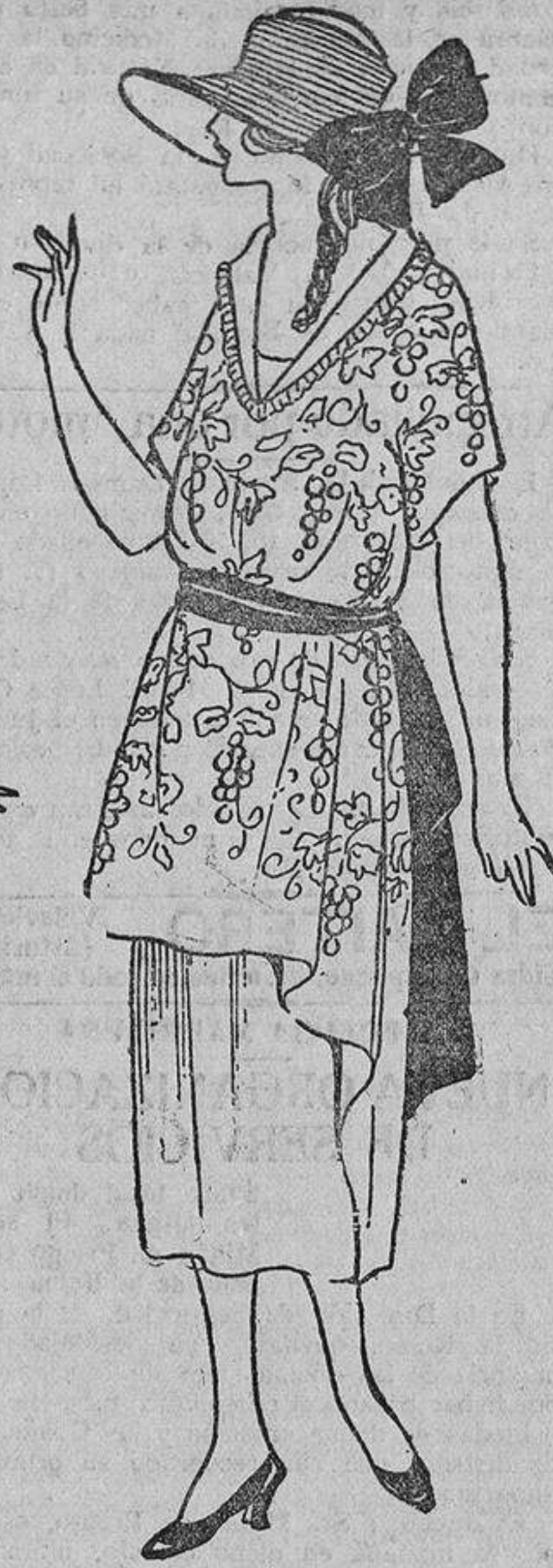
«Foulard» marino, bordado con uvas rojas; banda idem.

«Una asidua lectora de «Mar».—Procuraré enterarme y le comunicaré su dirección.