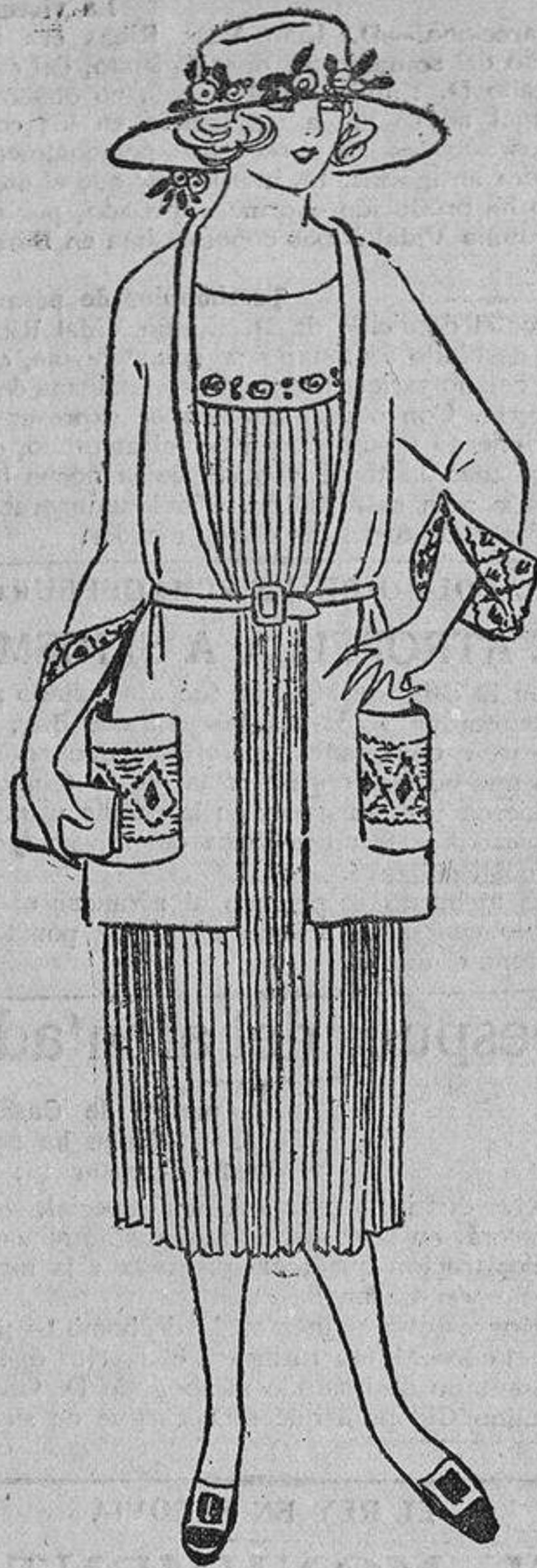
Para jovencita este sencillo vestido de tussor de seda o hilo crudo, bordado en rojo.

«Zarza».—¿Qué distracción, dirigir su carta al señor Administrador, interrumpiendo su labor con esa clase de preguntas que sólo las mujeres comprendemos! 1.ª Un agua de belleza y polvos. 2.ª Un especialista, por medio de la electricidad.