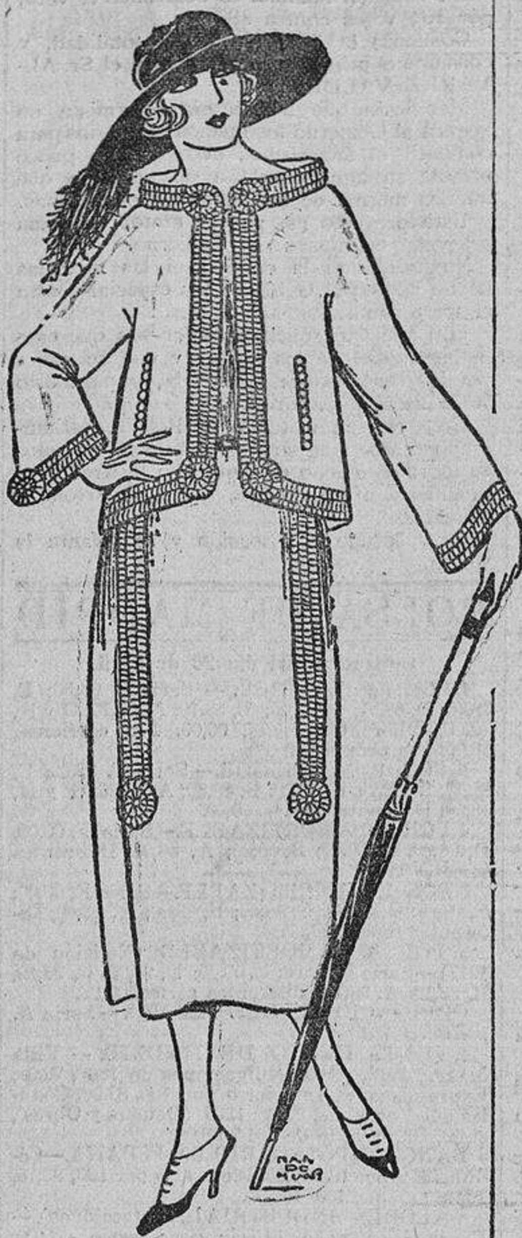
Sarga azul marino oscuro; el adorno está formado por cintas de faya, estrechas y fruncidas.

Los velos se colocan ahora al borde de los sombreros; en las tocas drapeadas adoptan el estilo árabe y en los sencillos tricornos, en forma de antifaz veneciano.