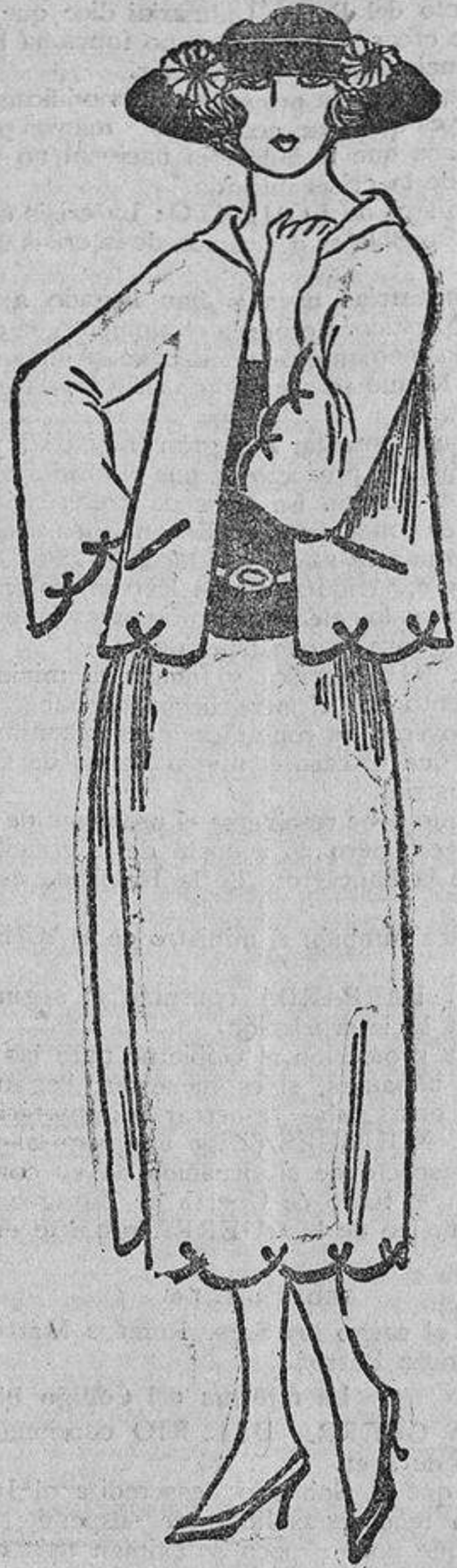
Duvelina granate y ondas ribeteadas con cinta encerada negra.