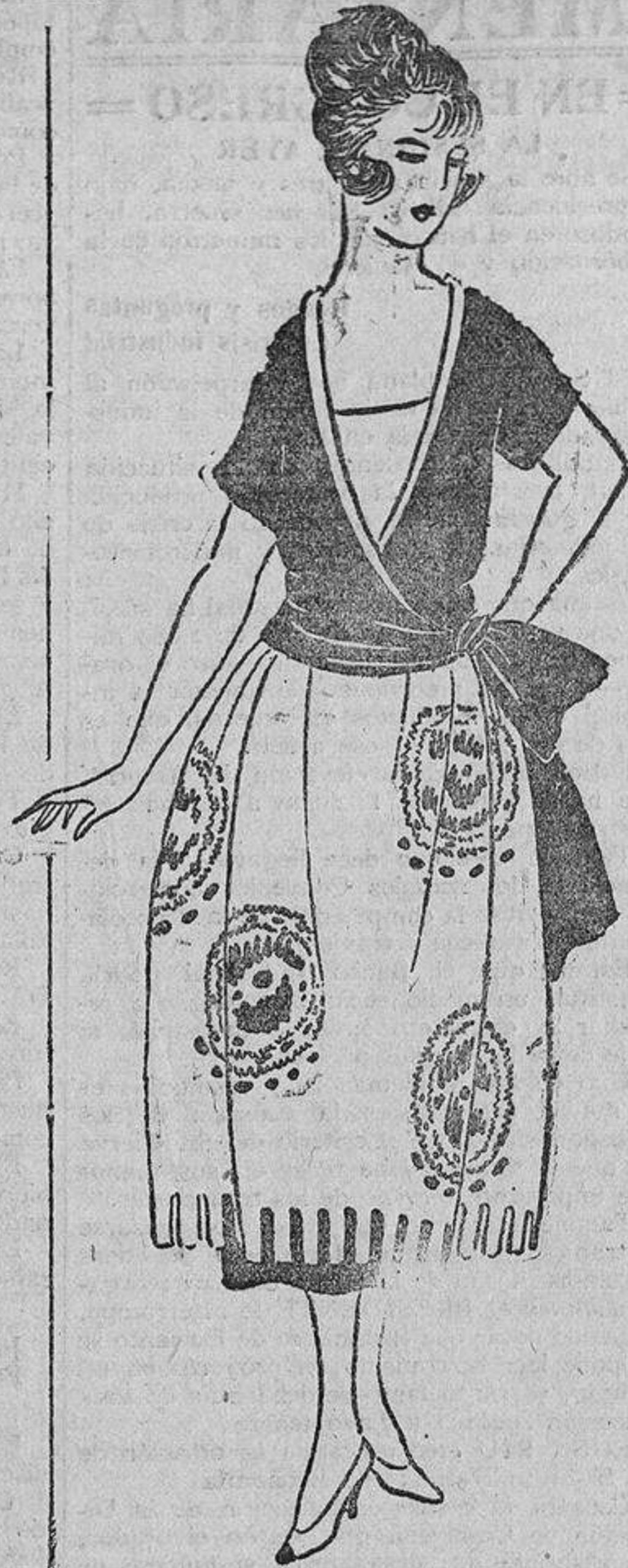
Sobre una funda de tafetán negro, una túnica de crespón de seda o gasa negra o azul rey con bordados de azabache.

El último «chico» consiste en el velo bordado con una franja compuesta por cantidad de briznas de pluma glicerizada. Ver la vida a través de una pluma ligera, ¡qué bonita fantasía y qué símbolo!