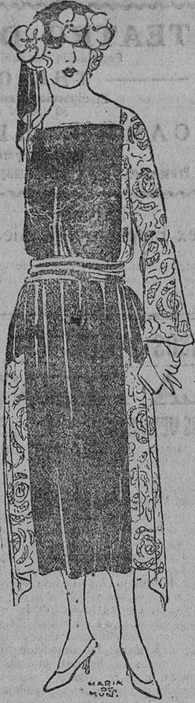
De raso mate azul marino con encajes finos teñidos en el mismo tono,

Sin duda la Princesa Elena diría: —¿Te has fijado, Carol, que los ministros de Francia e Inglaterra no ocupaban