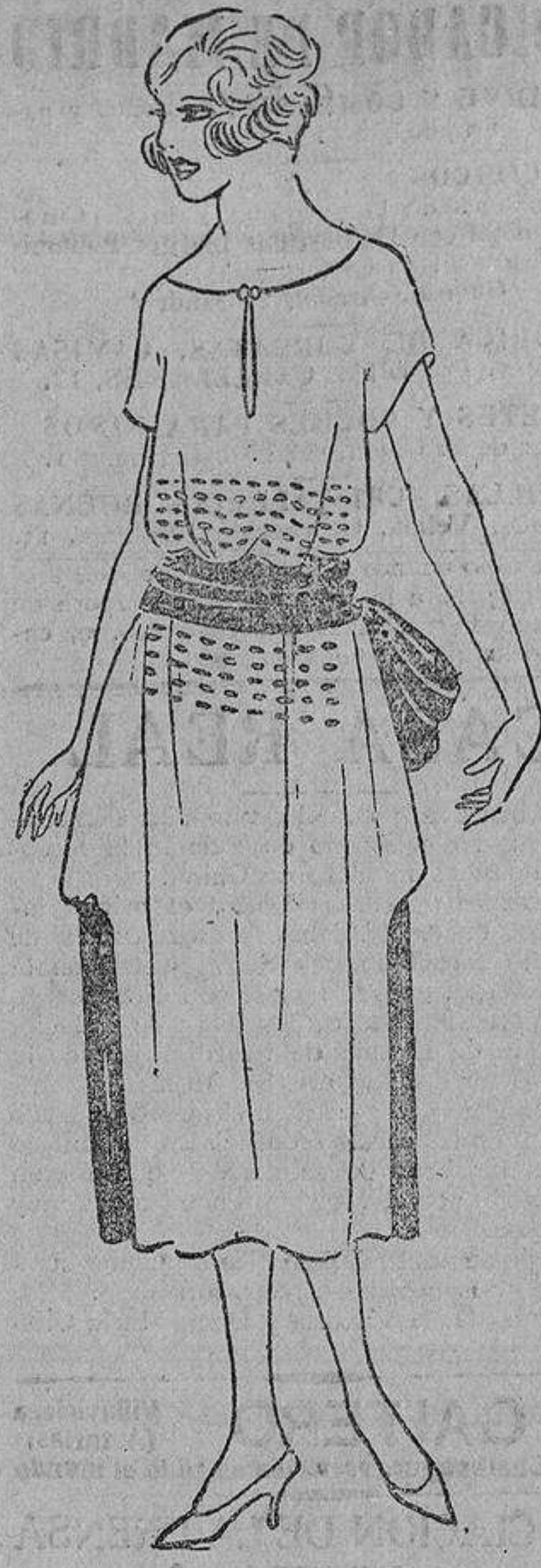
Azul marino, de crespón, bordados rojo y oro, y a los lados tiras rojas de crespón.

CORALINE EL MEJOR DENTIFRICO EN TODAS LAS PERFUMERIAS