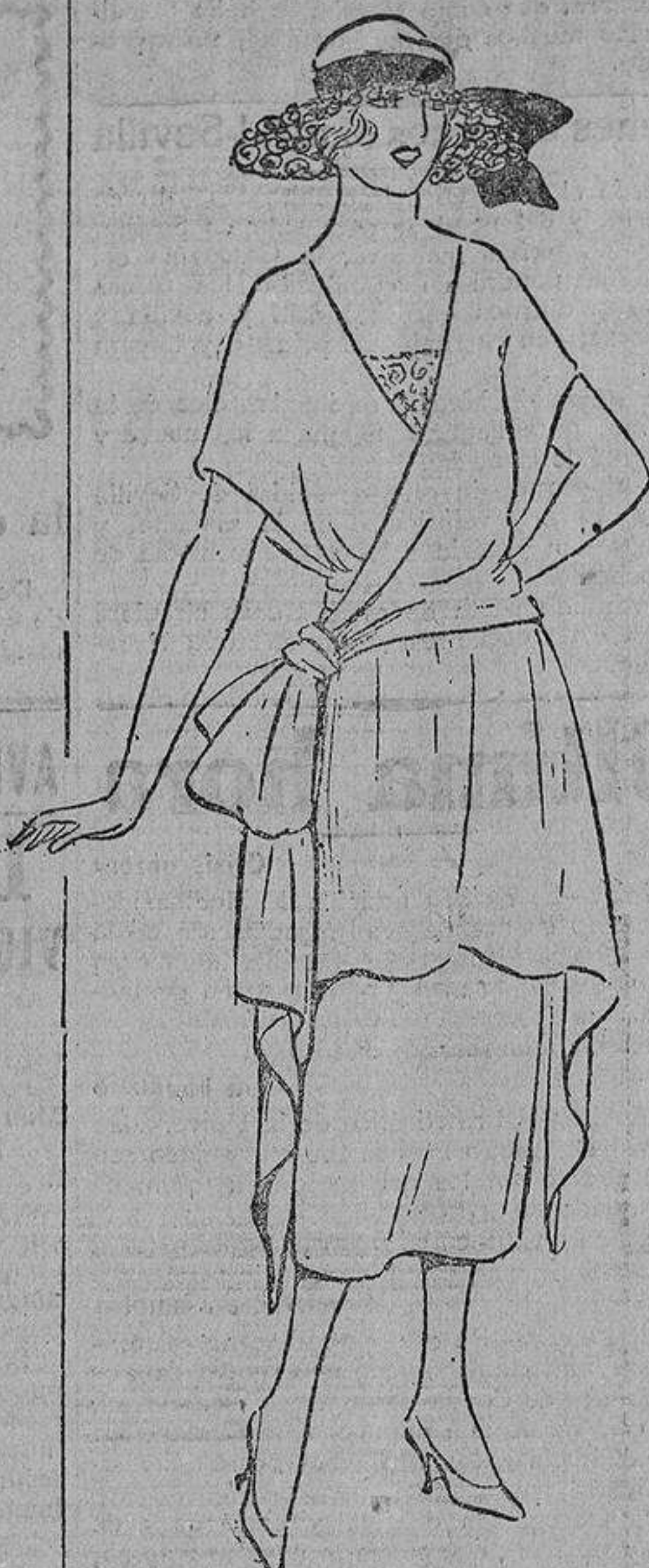
De crespón de seda mate color salmón pálido; cuerpo cruzado rematado en gran lazo; volante que cae a los lados, hacia detrás.