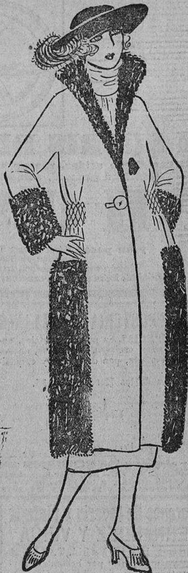
Sobre un abrigo de duvetina verde oscuro, unos pedazos de piel de nutria solamente a los lados, así como unos frunces «nido de abeja», sujetando los vuelos de la cintura.

Para conservar el cutis claro y fresco, la piel suave y flexible, hay que vigilar principalmente la salud. Evitad las grandes fatigas; la vida de noche fatiga mucho y se refleja en el rostro. Bebed poco, o aún mejor nada, de vino ni de bebidas