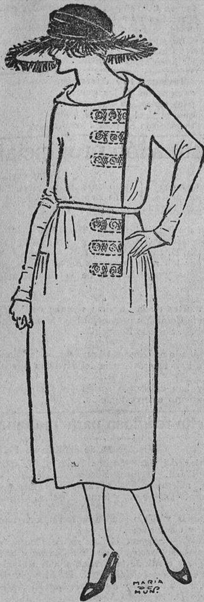
Es sencillito y muy «mono» este vestido de fina sarga marino con bordados rojo, azul y oro, y un ligero frunce, sólo a los lados.

alcohólicas; pocos alimentos grasos; vi-nagres, charcuterías y especias, las menos posible. La salud es la principal base de la belleza del cutis.