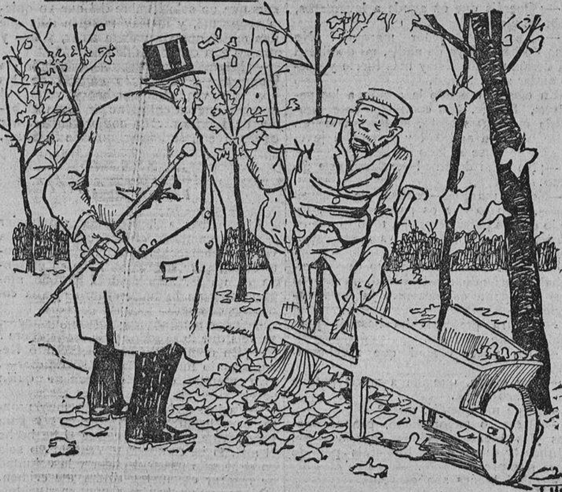
El juez, que distrae sus ocios dando un paseito.—Y entre tantas, ¿no habrá alguna clandestina?