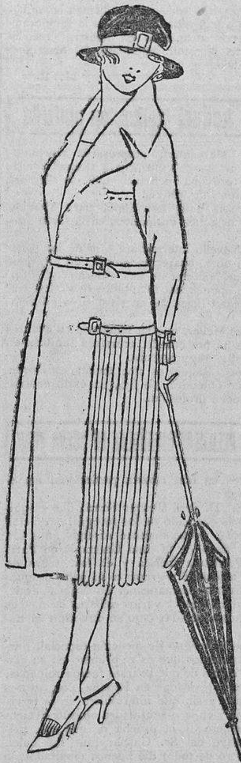
En este abrigo no hay bordados, solamente unos pliegues menudos a los lados, rematados con una tira de piel y una hebilla.

que se consiguen con la ayuda de volantes colocados en las caderas de «paniers» modernizados y sabiamente ahuecados, o bien el mismo vuelo del vestido sostenido por alambres.