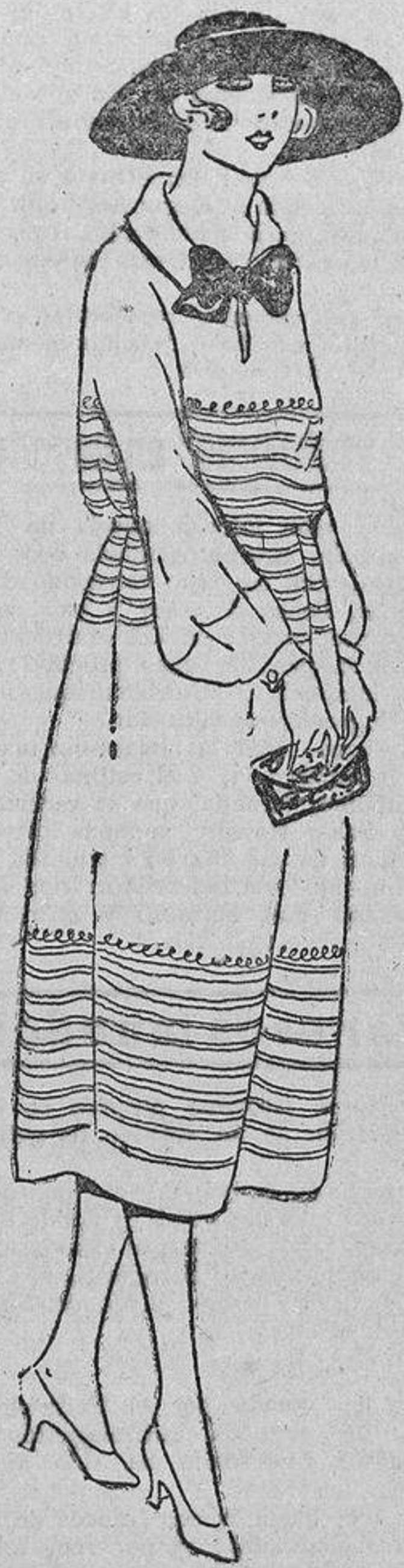
¿Qué es este adorno tan sencillo sobre el vestido, más sencillo todavía? Unas hileras de «soutache» blanco lavable o bordados al cordoncillo.

La manga larga y estrecha intenta tímidamente aparecer; esto es un buen síntoma para este invierno. Falta saber si esta tendencia de cubrir las carnes obedece a un sentido y cordura o al frío que se acerca. Estas mangas largas van muy bien con las amplitudes de los vestidos,