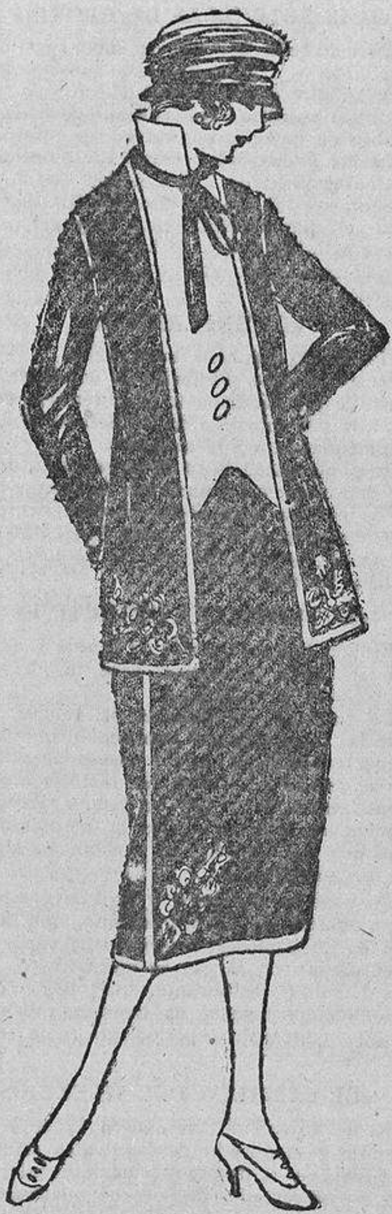
No siempre ha de ser completamente liso un traje sastre; no protestará este modelo si se le bordan unos motivos blancos, como la trencilla que lo bordea y el chaleco.

¡Qué bonito resulta un pie bien calzado, y cuánto influye en la elegancia de una figura! No es extraño que las coquetas le presten tanta atención y procuren no caer en las trampas que la moda a menudo tiende a las precipitadas. Para estar bien calzada hace falta tener un pie ni largo ni corto, ancho o grueso; es necesario no solamente el arte del zapatero que nos enfunda el pie con gracia, sino también un gusto personal muy seguro, que nos haga retroceder ante toda novedad cuando no favorece. Así, por ejemplo, mis ojos no pueden acostumbrarse a esas botas con caña de piel de cabritilla blanca. Quizás sea que la casualidad no me ha ofrecido mas que pies poco elegantes así calzados. El único mérito que hay que reconocerles, si ése puede ser un mérito, es que atraen las miradas; no pasan inadvertidos, no, esos inmodestos, y es una lástima que