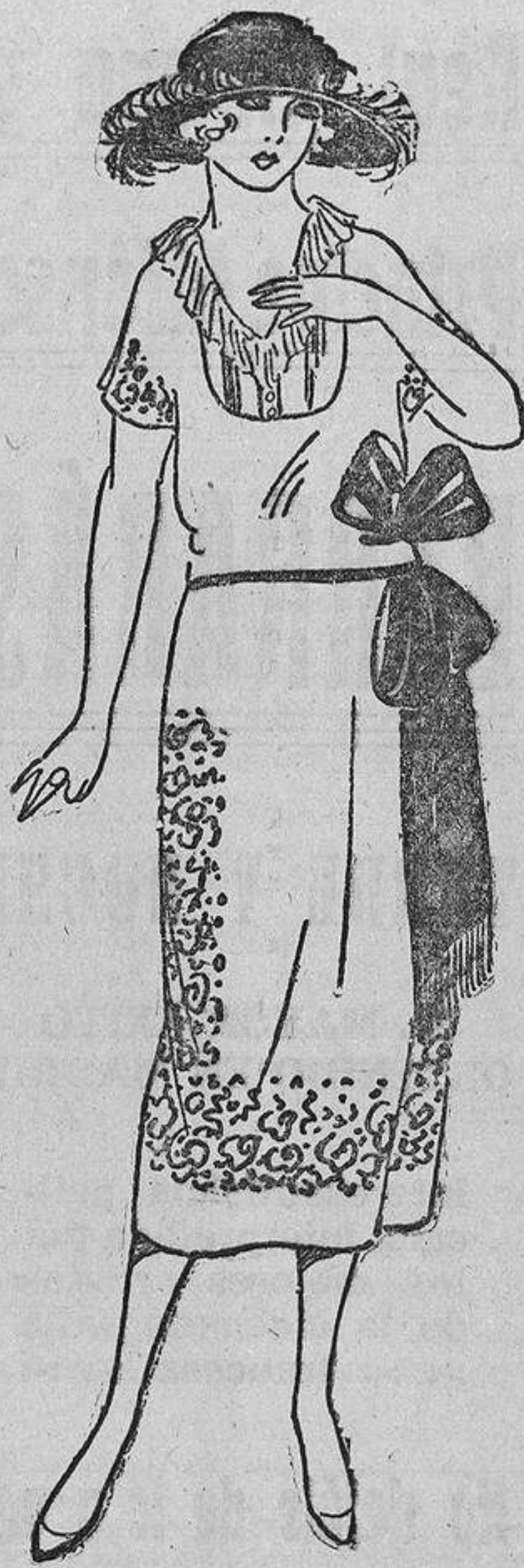
Está bien la idea esa de la abertura en el talle para dejar pasar la banda azul Talavera, del color de los bordados, que va tan bien con el tono paja del vestido.